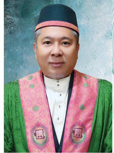
داتو سري ستيا دوكتور حاج نورعرفان بن حاج زينل ريكتور

قد تاهون اين، حفل التخرج مپنارايکن سرامي (454) اورغ كرادوان قنرما اجازه دان ديشلوما دالم قلباكا ي بيدغ دان قريشكت قجاجين. قارا كرادوان اين ترديري درقد (7) اورغ قنرما اجازه دوكتور فلسفه، (73) اورغ قنرما اجازه سرجان، (10) اورغ قنرما ديشلوما