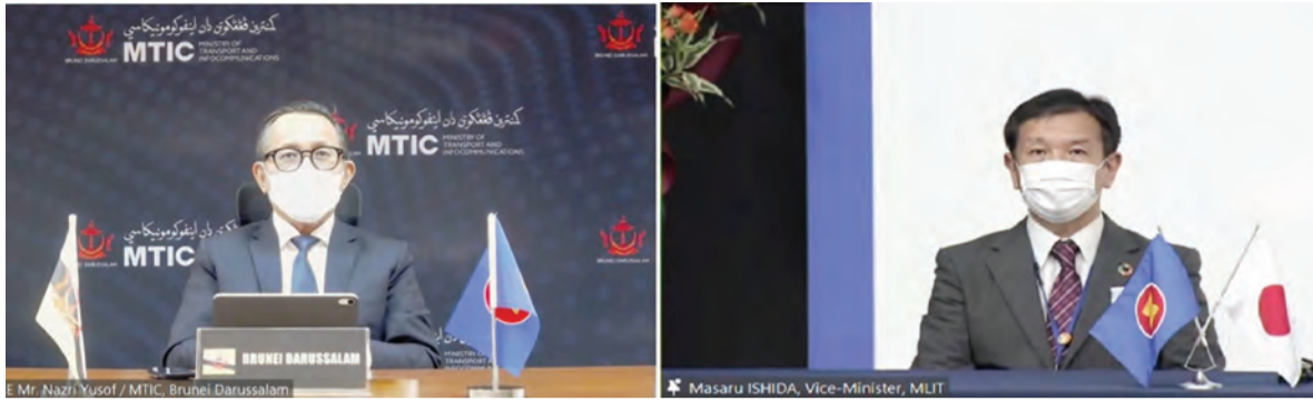
SETIAUSAHA Tetap di Kementerian Pengangkutan dan Infokomunikasi, Negara Brunei Darussalam dan Vice-Minister for Land, Infrastructure and Hokkaido Development, Ministry of Land, Infrastructure, Transport and Tourism of Japan semasa menyampaikan ucapan alu-aluan, pada The 3rd ASEAN-Japan Smart Cities Network High Level Meeting berlangsung secara dalam talian.

BANDAR SERI BEGAWAN, Selasa, 19 Oktober. - The 3rd ASEAN-Japan Smart Cities Network High Level Meeting berlangsung secara dalam talian, pada 18 dan 19 Oktober 2021, di Aichi, Jepun.