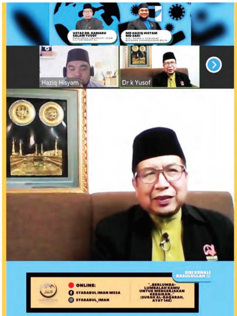
FORUM Frontliners : 'The Untold Sacrifices', yang disiarkan secara maya, menerusi media sosial Facebook dan Instagram Syababul Iman Masjid Sultan Sharif Ali, Kampung Sengkurong.

BANDAR SERI BEGAWAN , Isnin, 4 Oktober. - Pelbagai cabaran dilalui sepanjang berkhidmat dalam sama-sama membantu Kementerian Kesihatan, seperti cabaran dari segi operasi, sumber, komunikasi juga peribadi. Dari segi operasi, pada awalnya Sukarelawan Belia ditubuhkan secara serta merta dengan niat