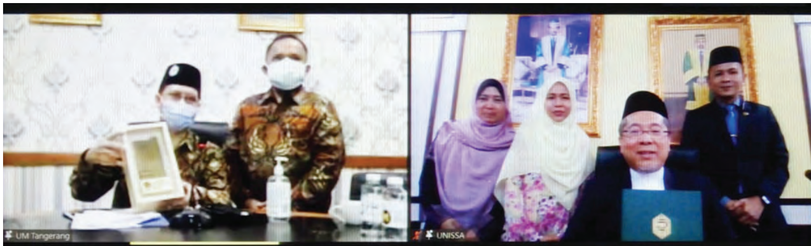
UNIVERSITI Islam Sultan Sharif Ali ketika mengadakan Majlis Penandatanganan Memorandum Persefahaman (MoU) bersama Universitas Muhammadiyah Tangerang Indonesia secara maya melalui platform persidangan video.

bahawa dengan penandatanganan MoU ini maka perancangan untuk mengimplementasikan apa jua program-program kerjasama antara UMT dan UNISSA terutama daripada aspek pendidikan, penyelidikan, pengabdian kepada masyarakat dan pengembangan nilai-nilai Islam yang menjadi ruang lingkup kerjasama yang perlu direalisasikan.