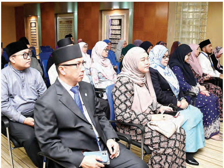
ANTARA yang hadir pada majlis berkenaan.

Diharap dengan adanya mushaf-mushaf ini akan dapat dimanfaatkan sepenuhnya sampai bila-bila, kerana pada hakikatnya, Al-Quran diturunkan sebagai panduan untuk kejayaan umat Islam di dunia dan akhirat.