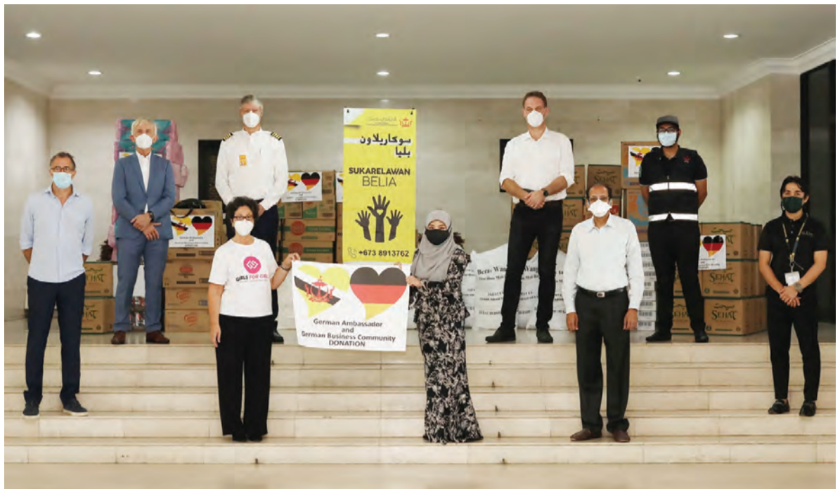
SETIAUSAHA Tetap (Kemasyarakatan dan Kebudayaan), Kementerian Kebudayaan, Belia dan Sukan semasa menerima sumbangan daripada Puan Yang Terutama Duta Besar Istimewa dan Mutlak Republik Persekutuan Jerman ke Negara Brunei Darussalam pada Projek Sumbangan Secara Pandu Lalu tersebut.

Hari Penyatuan Republik Persekutuan Jerman diraikan bagi memperingati perpaduan nasional dalam mengakhiri perpecahan selama berpuluh-puluh tahun, iaitu semasa tembok yang dibina pada 1961 menembusi Jerman dan negara-negara Eropah serta seluruh dunia setelah beberapa dekad.