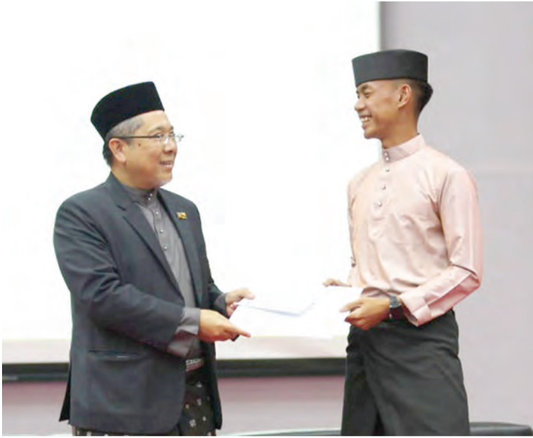
REKTOR Universiti Islam Sultan Sharif Ali (UNISSA) (kiri) menyampaikan Anugerah Khidmat Masyarakat Sesi 2019 / 2020 dan Penyampaian Insentif bagi Pelajar Yang Mengharumkan Nama UNISSA 2020.

Siaran Akhbar dan Foto : Universiti Islam Sultan Sharif Ali