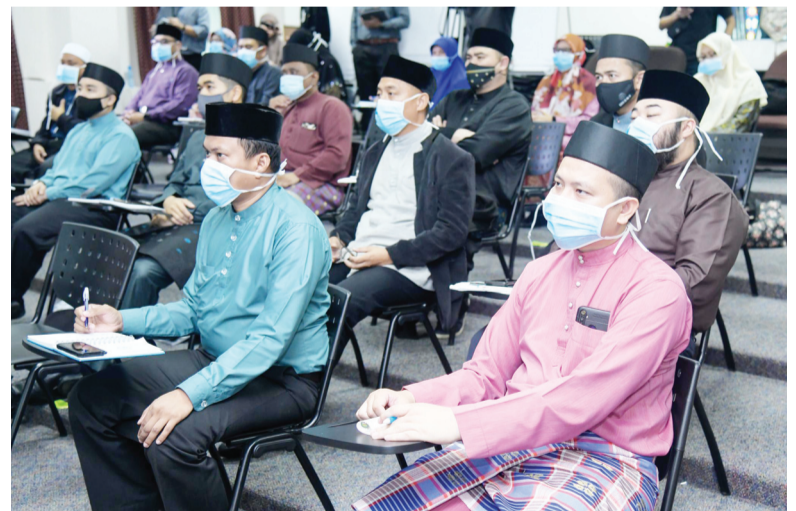
ANTARA tujuan bengkel adalah bagi memperkasa strategi dakwah yang relevan dengan keadaan dan perkembangan, di samping memantapkan metodologi dakwah juga da'ie yang berwibawa.

Bengkel antara lain bertujuan bagi memperkasa strategi dakwah yang relevan dengan keadaan dan perkembangan di samping memantapkan metodologi dakwah dan da'ie yang berwibawa dan