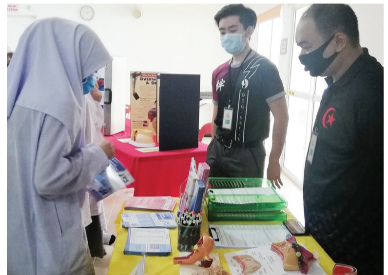
PAMERAN sempena Majlis Ilmu 2020 tersebut.