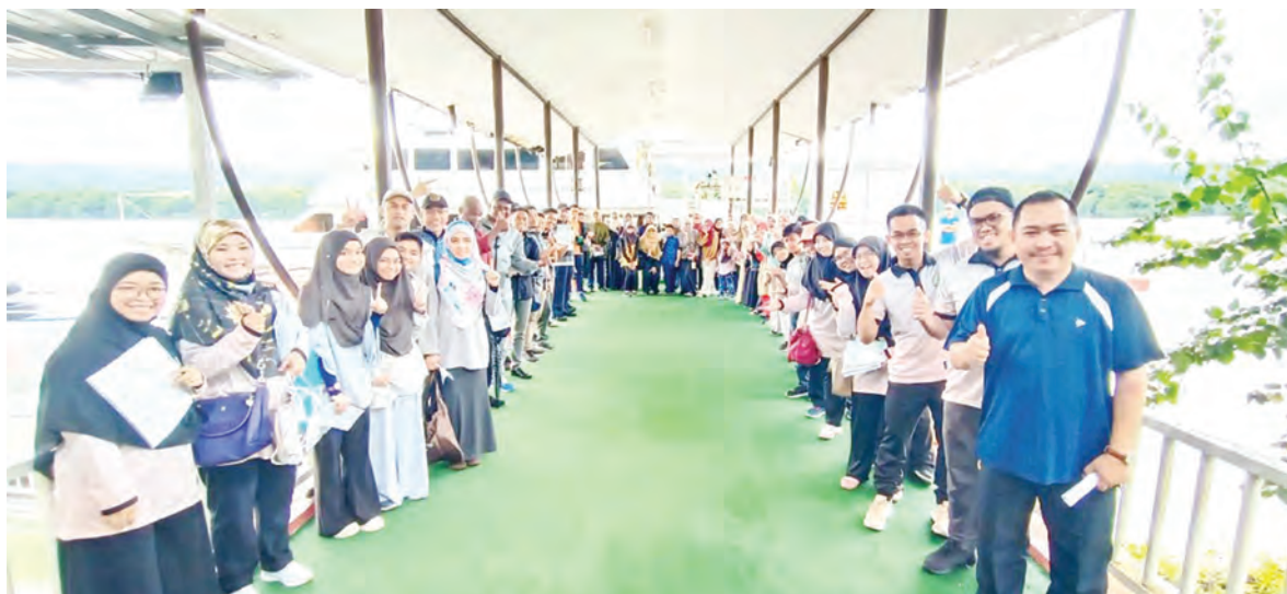
ANTARA yang mengikuti Program Wonders of Sungai Brunei (kiri, atas dan bawah).

BANDAR SERI BEGAWAN, Sabtu, 17 Oktober. - Bersempena dengan Sambutan Jubli Emas