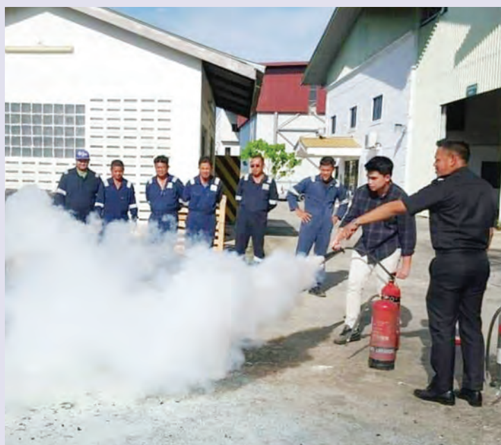
PARA peserta diajarkan secara praktikal cara-cara menggunakan alat pemadam api yang betul.