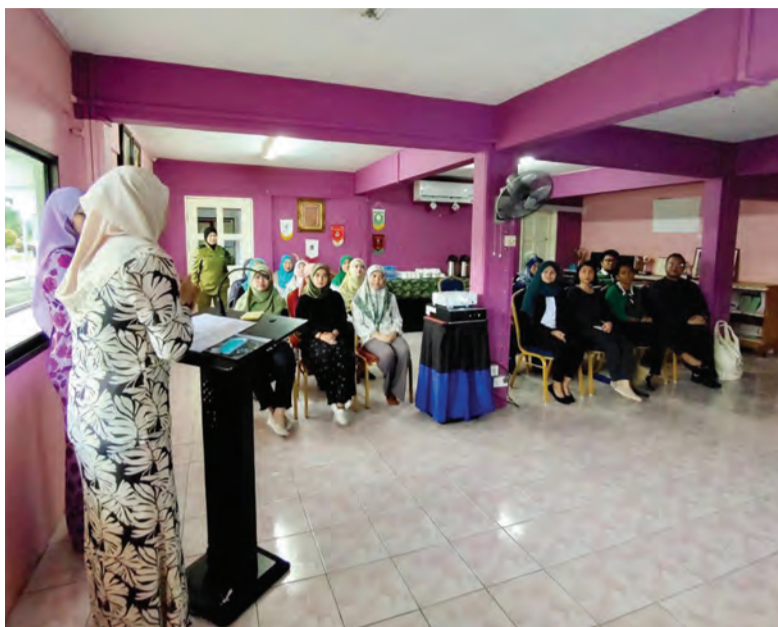
LAWATAN ke Institusi Penjara Wanita di Jerudong memberikan pendedahan kepada mereka tentang peranan dan fungsi institusi tersebut.

Siaran Akhbar dan Foto : Inisiatif Pemimpin Muda Selatan - Timur Asia