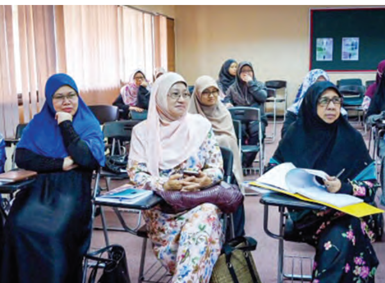
Siaran Akhbar dan Foto : Universiti Islam Sultan Sharif Ali

BANDAR SERI BEGAWAN , Sabtu, 8 Ogos. - Universiti Islam Sultan Sharif Ali (UNISSA) melalui Pusat Kepimpinan dan Pembelajaran Sepanjang Hayat menawarkan Program Mari