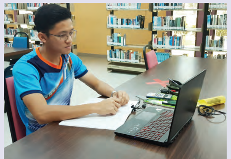
SEBELUM menghadapi peperiksaan, para pelajar harus membuat persediaan terlebih dahulu agar mendapat keputusan yang memuaskan.

Berita dan Foto : Dk. Vivy Malessa Pg. Ibrahim