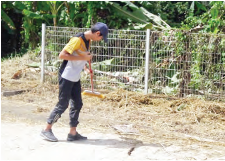
SALAH sebuah syarikat usaha sama belia bersama Management Jasa Biru menawarkan dua perkhidmatan, mencakupi keperluan masyarakat Brunei, iaitu Perkhidmatan Membaiki Penghawa Dingin secara menyeluruh dengan kadar bayaran sangat berbaloi dan terjangkau, iaitu serendah BND12; dan Perkhidmatan Memotong Rumput dengan kadar bayaran sebanyak BND10 (atas dan kanan).

BANDAR SERI BEGAWAN , Sabtu, 8 Ogos. - Menurut Laporan Kajian Tenaga Kerja 2019, kadar penyertaan tenaga kerja pada tahun 2019, menurun kepada 64.3 peratus daripada 65.4 peratus pada tahun 2018, iaitu kadar penyertaan bagi lelaki adalah lebih tinggi sebanyak 72.5 peratus, berbanding dengan perempuan 54.8 peratus.