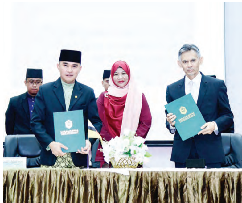
ACARA Pertukaran MoU di antara FEKIm, UNISSA dan Yasaar Advisory Services (B) Sdn. Bhd. yang disaksikan oleh tetamu kehormat.

Bengkel tersebut diharap akan dapat terus meningkatkan lagi kesedaran, khususnya dalam diri peserta tentang kepentingan bekerja sendiri dan mengangap pilihan dalam bidang keusahawanan merupakan pilihan realistik mencari sumber rezeki yang halal dalam kehidupan.