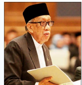
YANG Berhormat Pehin Datu Imam Dato Paduka Seri Setia Ustaz Haji Awang Abdul Hamid bin Bakal.

"Kapasiti bangunan masjid, mestilah dianggarkan mampu menampung penduduknya yang beragama Islam dalam jangka masa panjang dengan turut disediakan keluasan yang berpatutan bagi para jemaah dan memberi kemudahan bagi future expansion jika diperlukan di kemudian hari.