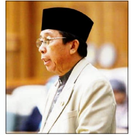
MENTERI Hal Ehwal Ugama, Yang Berhormat Pengiran Dato Seri Setia Dr. Haji Mohammad bin Pengiran Haji Abdul Rahman.

Mengambil kira hal-hal yang telah disebutkan tadi, insyaaAllah masjid akan turut menyerlahkan lagi syiar Islam di negara kita sebagai sebuah Negara Zikir," tegas Yang Berhormat.