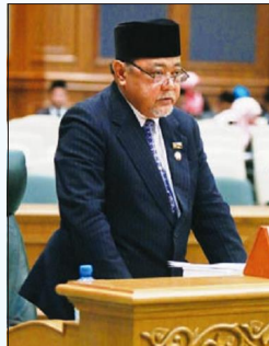
YANG Berhormat Awang Haji Sulaiman bin Haji Ahad.

Begitu juga halnya, tambah Yang Berhormat, dengan keperluan-keperluan dalam membangunkan kemajuan pertanian luar bandar dan seterusnya menggalakkan