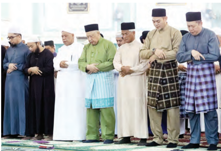
MENTERI di Jabatan Perdana Menteri (JPM), Yang Berhormat Dato Seri Setia Awang Haji Abdul Mokti bin Haji Mohd. Daud (empat, kanan), Pemangku Menteri di JPM dan Menteri Kewangan dan Ekonomi II, Yang Mulia Dato Seri Paduka Awang Ahmaddin bin Haji Abd. Rahman (dua, kanan) dan Timbalan Menteri Tenaga (Tenaga dan Tenaga Manusia) dan Perindustrian, Yang Mulia Dato Seri Paduka Awang Haji Matsatejo bin Sokiauw (tiga, kanan) semasa menunaikan Sembahyang Fardu Subuh berjemaah.