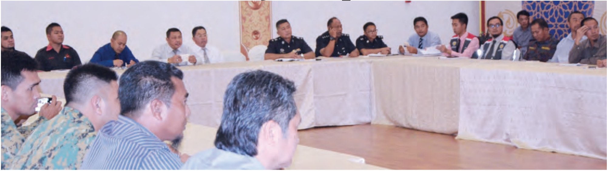
ANTARA yang hadir pada Taklimat Latihan Mini 'Table Top Exercise' (TTX) yang diadakan di Dewan Utama, Kompleks Dewan Kemasyarakatan, Tutong.

Berita dan Foto : Dk. Vivy Malessa Pg. Ibrahim