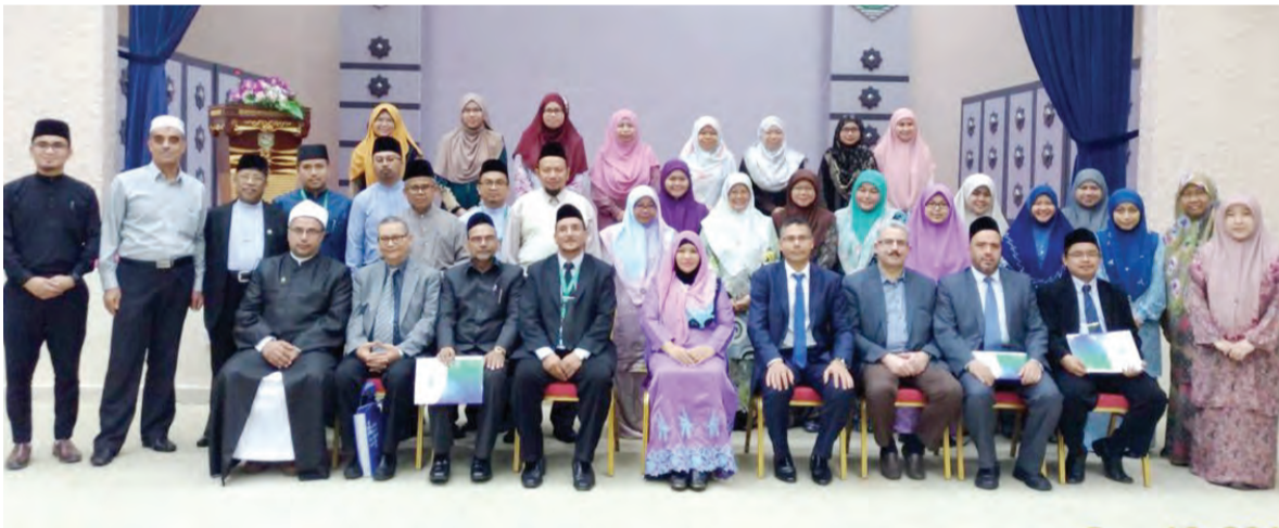
UNIVERSITI Islam Sultan Sharif Ali (UNISSA) melalui Fakulti Bahasa Arab (FBA) dengan kerjasama Pertubuhan Islam Dalam Bidang Pendidikan, Sains dan Kebudayaan (ISESCO) serta Penerbitan Granada dan Khidmat Pendidikan telah menganjurkan Multaqa Pendidikan Bahasa Arab di peringkat universiti di negara ini yang diadakan di Auditorium universiti berkenaan.

Siaran Akhbar dan Foto : Universiti Islam Sultan Sharif Ali