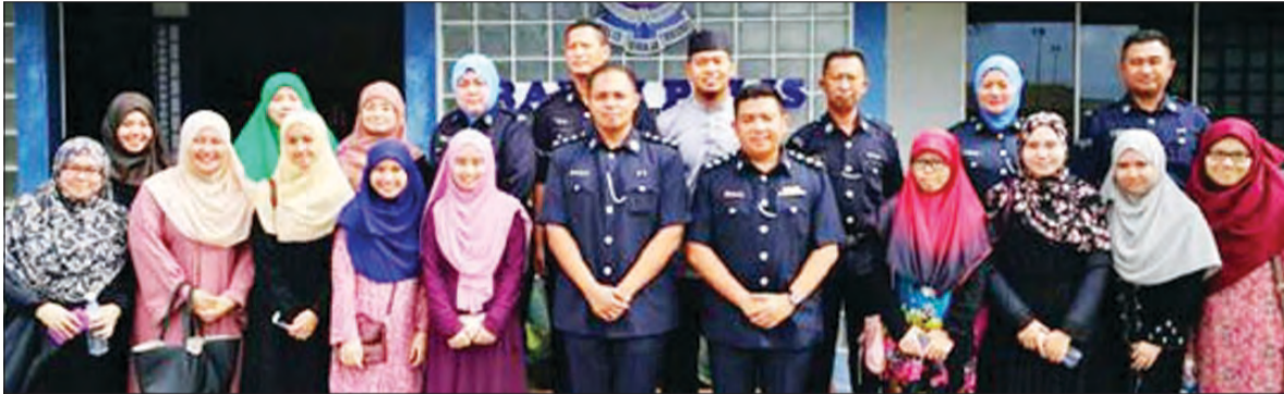
PARA penuntut Universiti Islam Sultan Sharif Ali (UNISSA) yang mengikuti Program Diploma Kebangsaan Tertinggi Keadilan Jenayah Syariah bergambar ramai semasa lawatan sambil belajar ke Balai Polis Berakas.