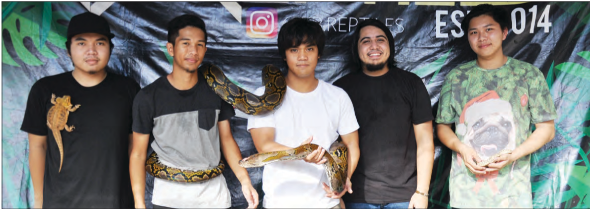
ULAR Sawa antara binatang eksotik yang dipamerkan pada Karnival 'Maritah ke Kelab Rekreasi Liang Lumut' (LLRC), Mukim Liang Siri Ke-9.