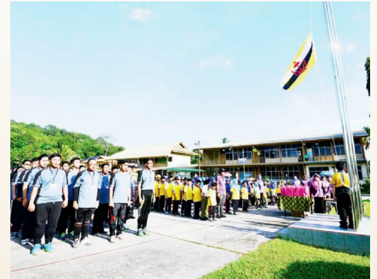
BELIA aset negara oleh itu wajar bagi mereka menzahirkan perasaan cinta dan semangat patriotik mereka kepada raja, negara, bangsa dan agama serta kesatuan dan perpaduan mereka pada mempertahankan kemerdekaan, kedaulatan dan identiti bangsa.

"Bagi menentu generasi berwawasan kita mestilah bermula pada diri kita sendiri dengan menanamkan wawasan hidup kita, wawasan untuk keluarga, agama, bangsa dan negara. Tetapi Wawasan 2035 tidak akan dapat kita capai tanpa adanya sokongan padu serta kerjasama yang jitu dari semua pihak samada pihak kerajaan atau