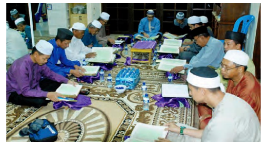
AHLI-AHLI Kumpulan WhatsApp Saudara Ku Kampung Setia mengadakan Majlis Bertadarus dari rumah ke rumah dalam kalangan ahli.

Aktiviti seumpamanya juga akan dijadikan sebagai aktiviti tahunan, di samping aktiviti juga projek amal kebajikan lain yang dijalankan.