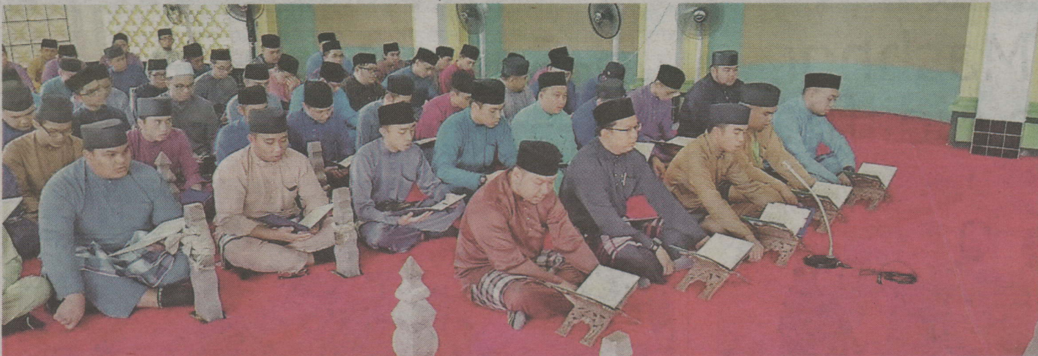
Para mahasiswa turut mengadakan Majlis Tahlil di Kubah Makam Diraja sempena Minggu Ta'aruf UNISSA.

BANDAR SERI BEGAWAN, 2 Ogos - Universiti Islam Sultan Sharif Ali (UNISSA), melalui Bahagian Hal Ehwal Pelajar dengan kerjasama Majlis Perwakilan Pelajar telah mengadakan Program Minal Jami'ah Ilal Masjid bagi mahasiswa tahun pertama sesi pengajian 2015/2016M sempena Minggu Ta'aruf Pelajar Baru bertempat di Masjid Perpindahan Kampung Mentiri, baru-baru ini.