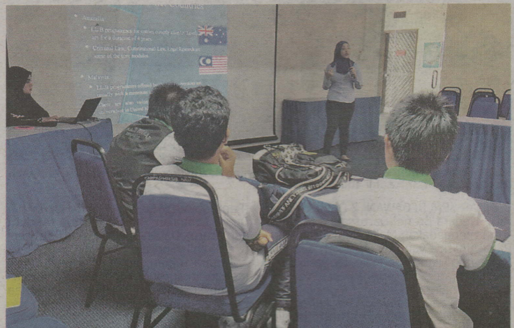
Salah seorang penasihat undang-undang dari Pejabat Peguam Negara ketika menyampaikan taklimat di majlis itu.

Taklimat tersebut diikuti dengan sesi soal jawab antara penasihat undang-undang dan para penuntut di mana pelajar diberikan peluang untuk mengetahui lebih lanjut mengenai peluang pekerjaan di Pejabat Peguam Negara.