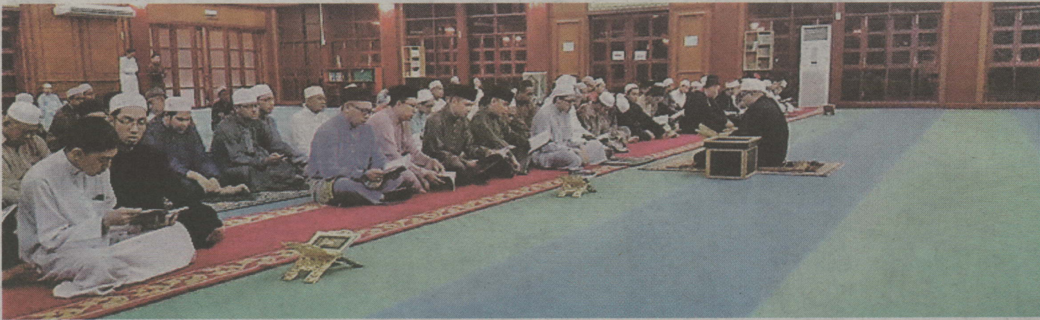
Program Minal Jami'ah Ilal Masjid yang diadakan di Masjid Perpindahan Kampung Mentiri.