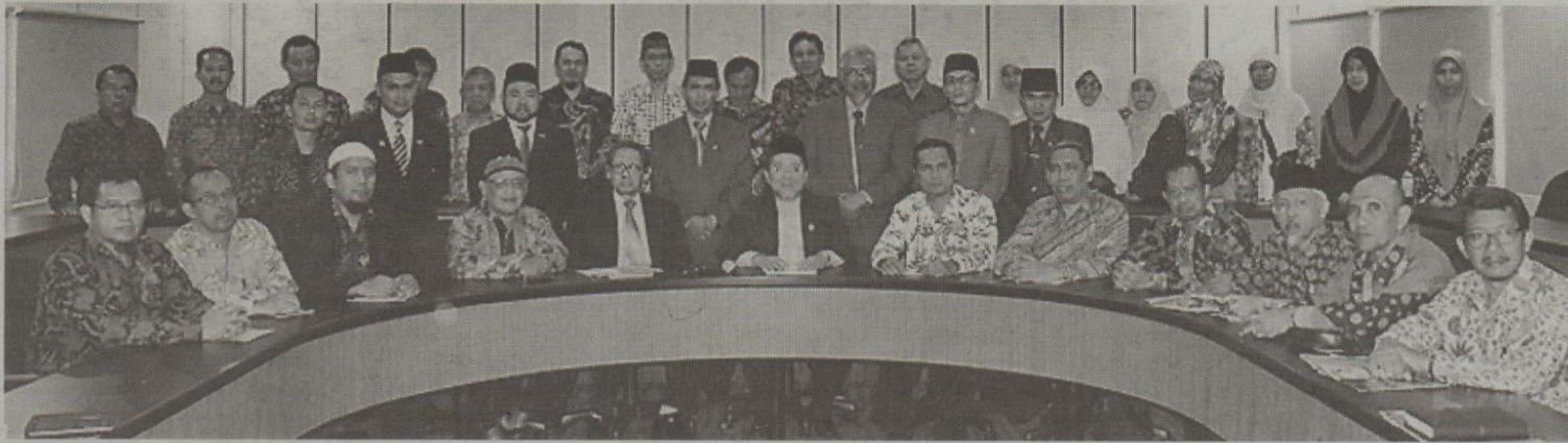
Gambar ramai rombongan UMS bersama pegawai-pegawai utama UNISSA.

BANDAR SERI BEGAWAN, 20 Julai - Universiti Islam Sultan Sharif Ali (UNISSA) hari ini telah menerima kunjungan hormat daripada rombongan seramai 29