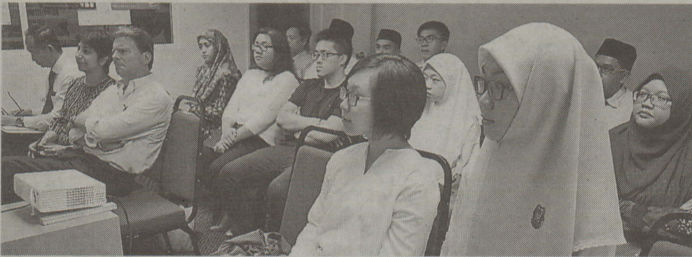
Antara pelajar-pelajar yang hadir mendengarkan seminar informasi berkenaan.