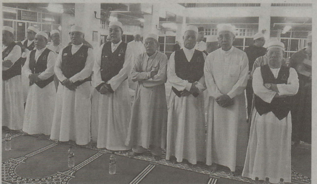
Antara yang hadir pada majlis berkenaan.