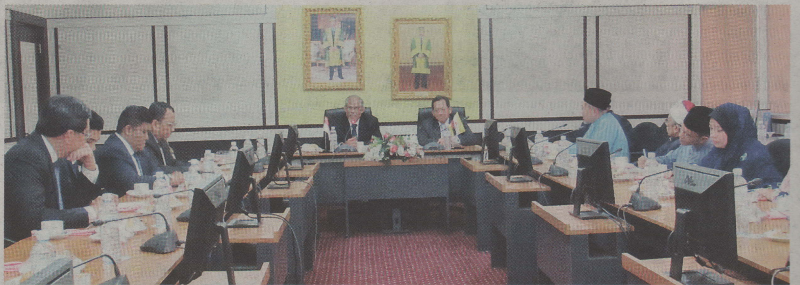
Yang Berhormat Pehin Haji Suyoi dan Masagos Zulkifli semasa kunjungan ke UNISSA kelmarin.

UNISSA pada awal penubuhannya mempunyai seramai 107 orang pelajar dan kini mempunyai lebih seribu orang