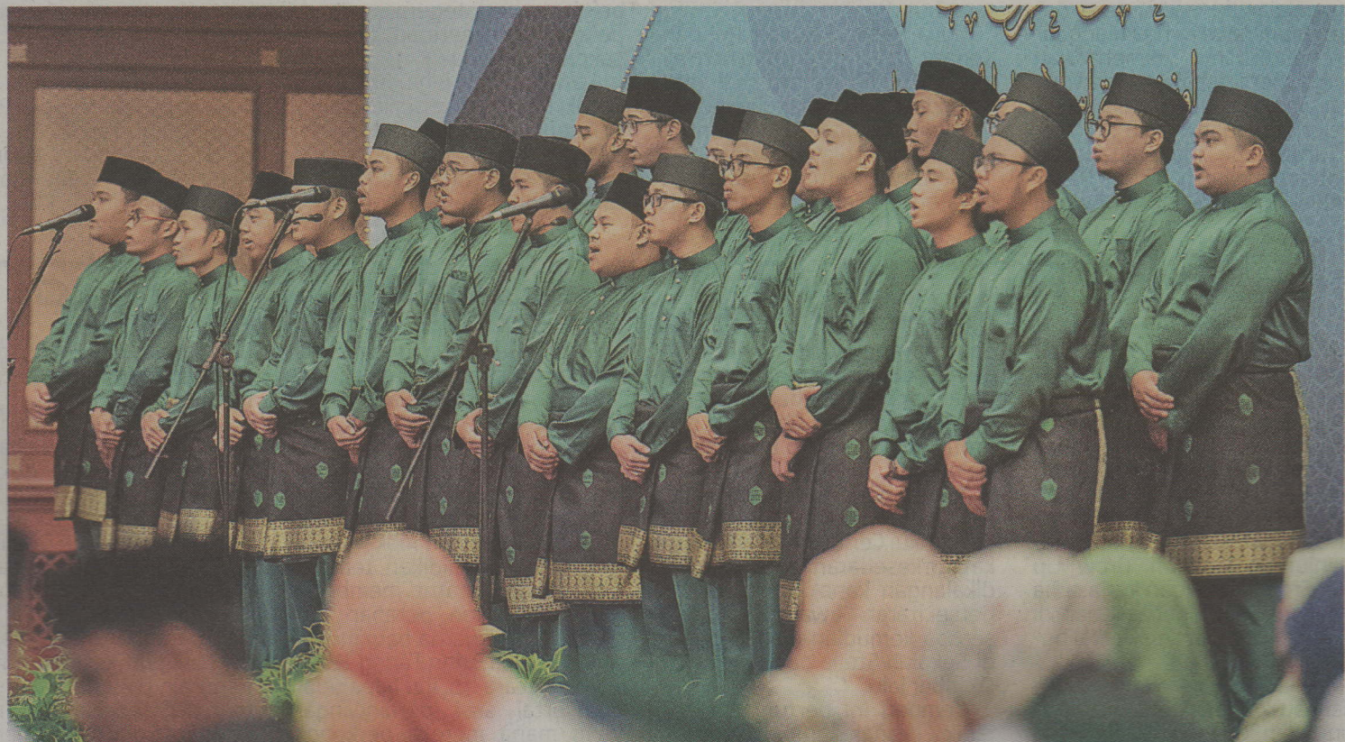
Antara persembahan yang diadakan bagi memeriahkan lagi majlis.