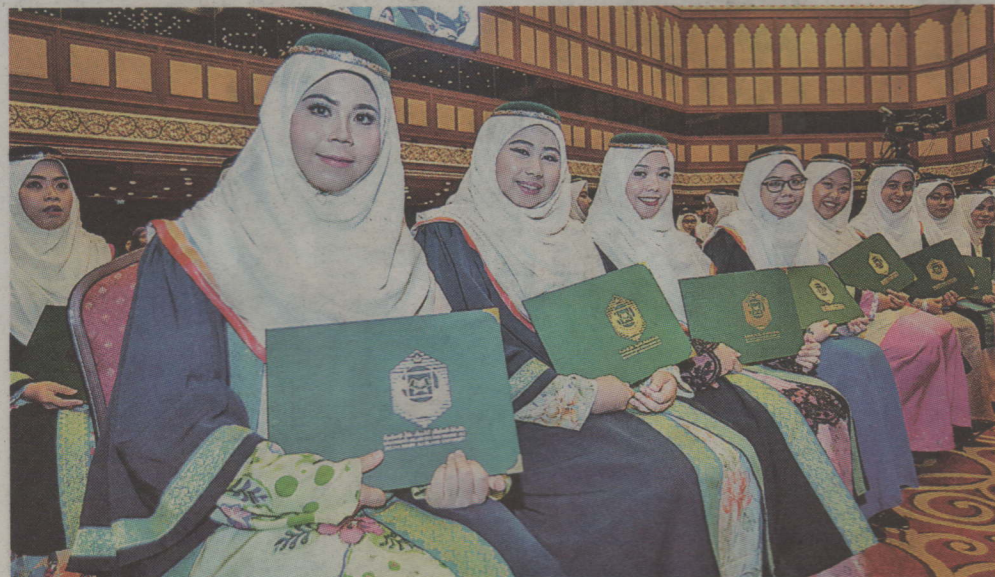
Antara graduan UNISSA yang diraikan pada majlis tersebut.

UNISSA pada tahun ini juga menawarkan program di bawah Pusat Penyelidikan Halalan Tayyiban dan Fakulti Pengurusan Pembangunan Islam untuk mempelbagaikan lagi peluang kursus-kursus yang boleh diikuti untuk melahirkan generasi berpendidikan sesuai menyangkut Wawasan Brunei 2035.