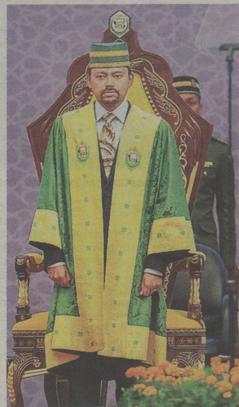
Duli Pengiran Muda Mahkota berkenan berangkat ke majlis tersebut.

Di samping itu, adalah menjadi tugas UNISSA dengan kepakaran yang dimiliki untuk memberikan khidmat kepada apa jua isu berkaitan hal-hal keagamaan.