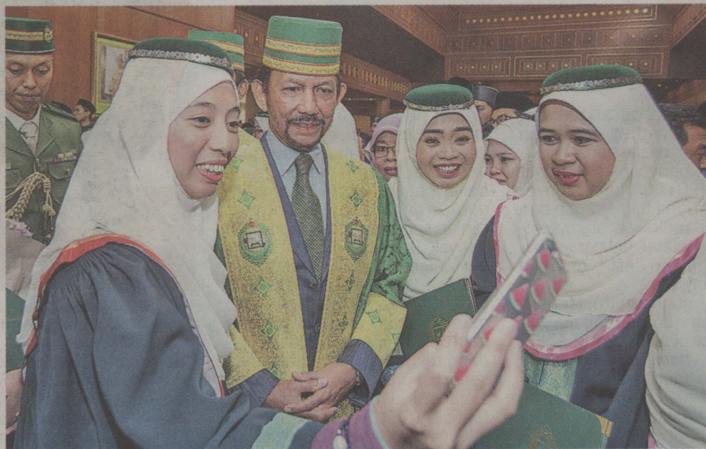
Kebawah Duli Yang Maha Mulia berkenan dijunjung bergambar bersama.

Hafli Al-Takharruj diimarahkan dengan bacaan ayat-ayat suci Al-Quran iaitu