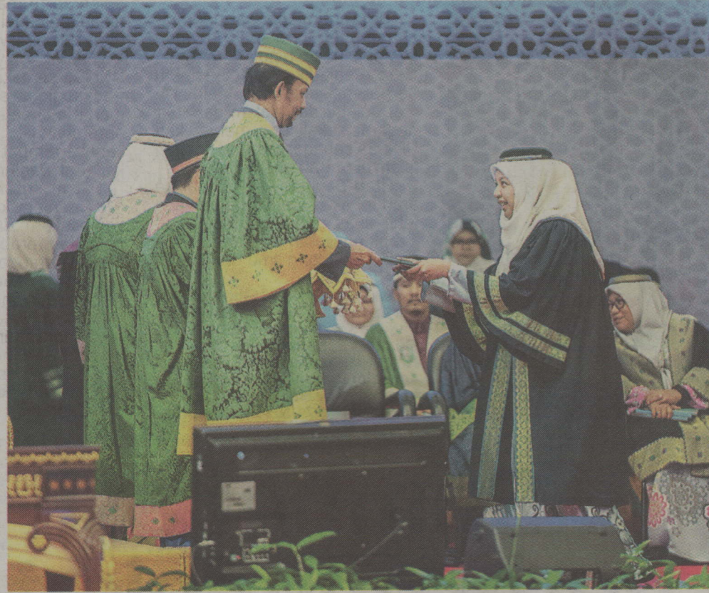
Kebawah Duli Yang Maha Mulia berkenan menyempurnakan pengurniaan ijazah dan sijil kepada para graduan UNISSA bersempena Majlis Hafli Al-Takharruj UNISSA ke-7.

Oleh Salawati Haji Yahya & Siti Nur Wasimah S.