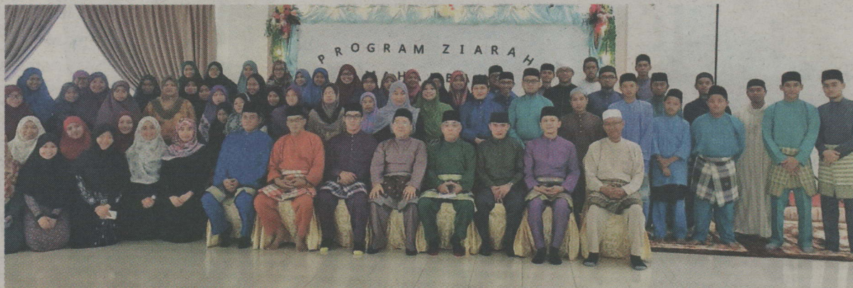
Sesi bergambar ramai bersama para program tersebut.

Kampung Kiudang, Kampung Batang Mitos dan Kampung Bakiau.