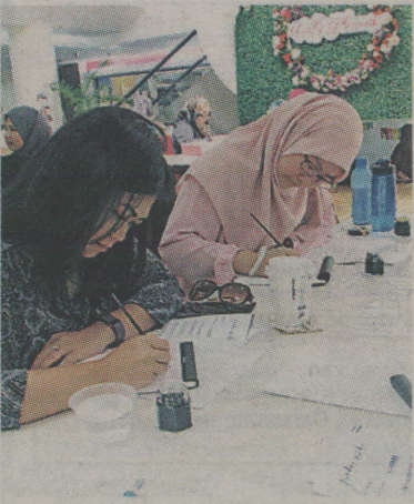
Suasana pada acara Crafty Planners.