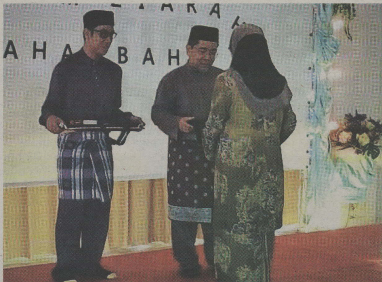
Rektor UNISSA menyerahkan sumbangan kepada keluarga yang terpilih di Mukim Kiudang, Tutong.