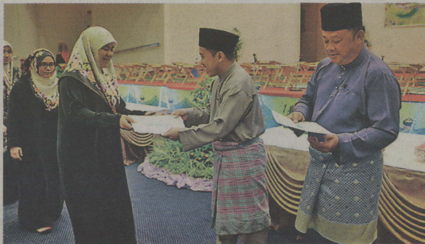
Penyampaian sijil Khatam Al-Quran warga Jabatan Bandaran KB dan Seria.