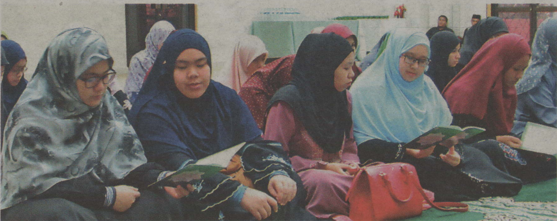
Antara warga UNISSA yang menghadiri majlis tiga dalam satu itu.