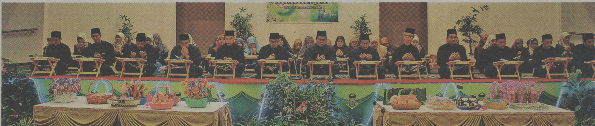
Warga Jabatan Bandaran Kuala Belait dan Seria turut menyemarakkan bulan Ramadan dengan Majlis Khatam Al-Quran.