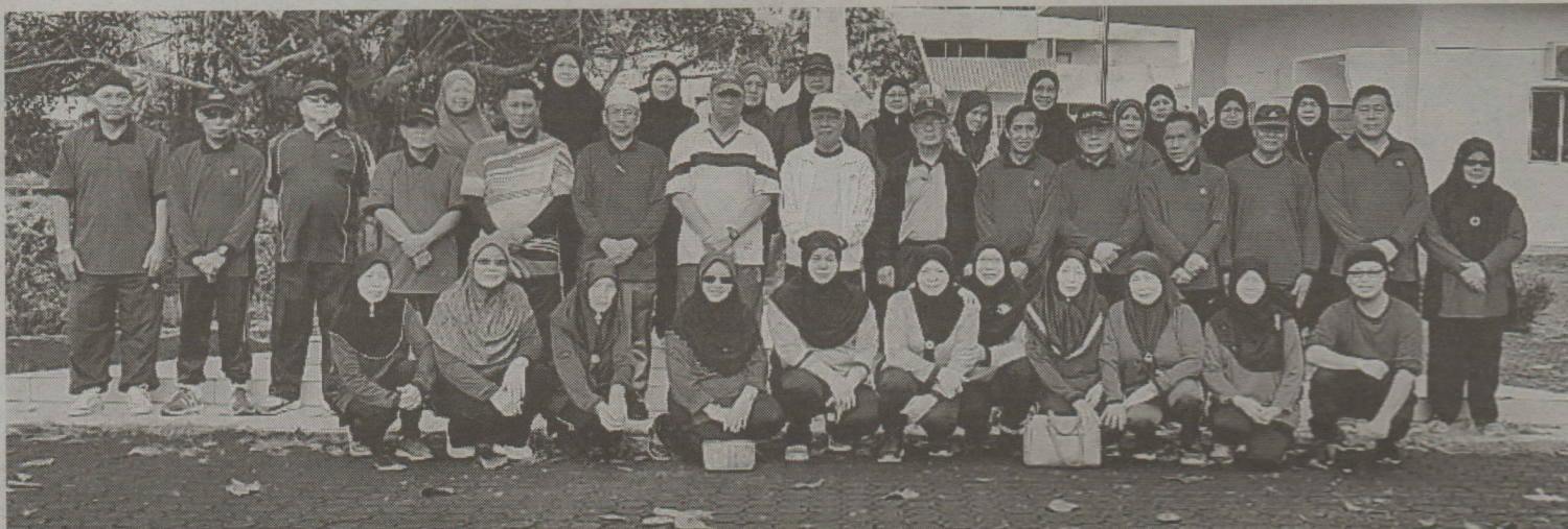
Gambar ramai ahli-ahli PKWE Tutong semasa majlis pelancaran senaman Tai Chi.

Senaman ini juga dapat membantu masalah pernafasan, sendi-sendi dan otot serta membantu menurunkan tinggi darah dan mengurangkan masalah pencernaan usus.