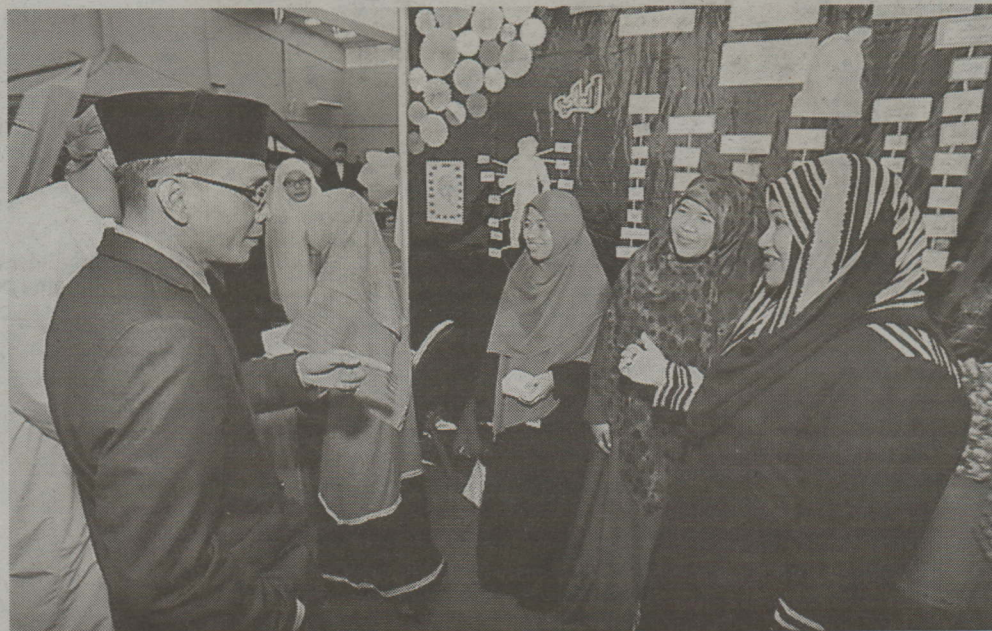
Pemangku Rektor UNISSA menerima penerangan berkenaan pameran berkenaan.

Apa yang menarik dalam festival berkenaan ialah para pelajar digalakkan untuk menyumbang idea dan kreativiti dalam mempelbagaikan jenis permainan