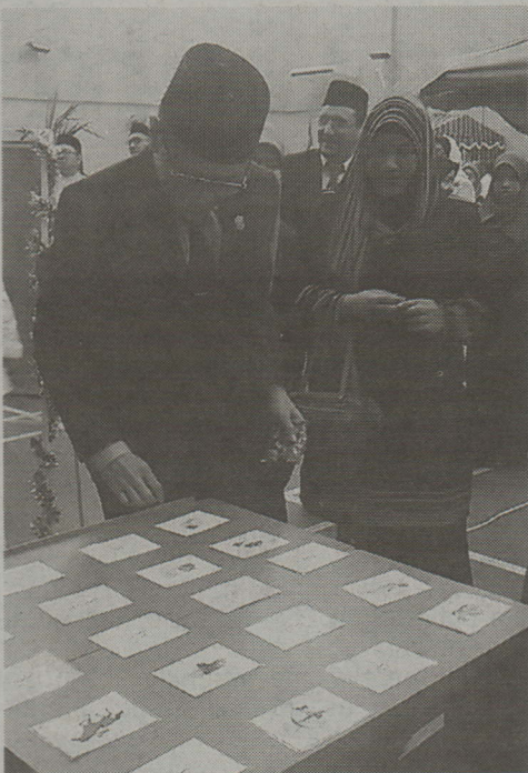
Pemangku Rektor UNISSA semasa menyaksikan pameran.

Festival berkenaan menyasarkan penyertaan pelajar UNISSA, Kolej Universiti Perguruan Ugama Seri Begawan (KUPUSB), Institut Tahfiz Al-Quran Sultan Haji Hassanal Bolkiah, sekolah-sekolah Arab dan orang ramai yang mencintai Bahasa Arab.