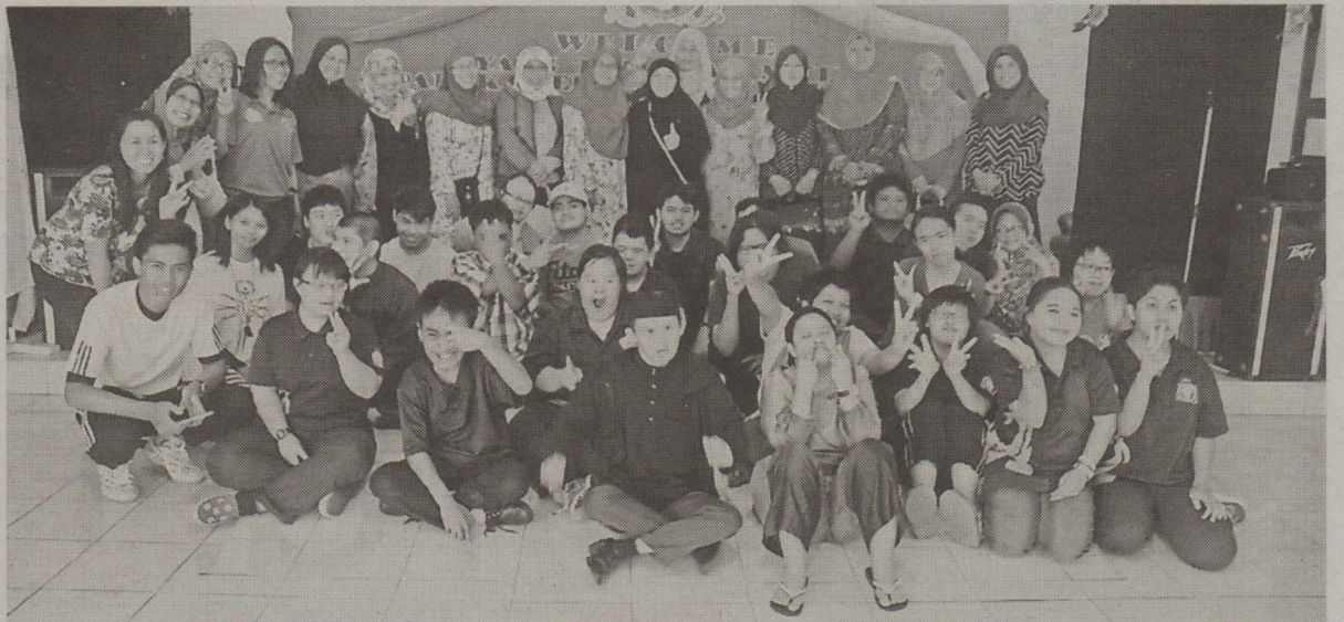
Kanak-kanak istimewa Pusat Ehsan bergambar ramai bersama ahli GCD.

di samping memberikan dan berkongsi kemahiran baru bersama kanak-kanak Pusat