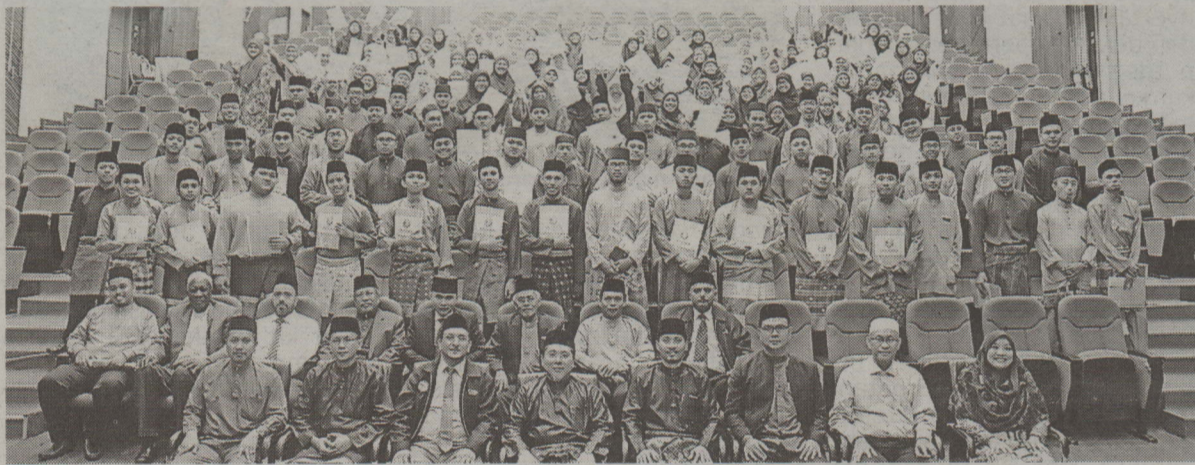
Para mahasiswa UNISSA yang tamat Kursus Intensif Bahasa Arab bergambar ramai bersama rektor UNISSA di Dewan Jubli, UNISSA.

BANDAR SERI BEGAWAN, 10 Mei - Seramai 147 mahasiswa Universiti Islam Sultan Sharif Ali (UNISSA) berjaya menamatkan Kursus Intensif Bahasa Arab selama dua bulan, bagi sesi akademik 2016/2017.