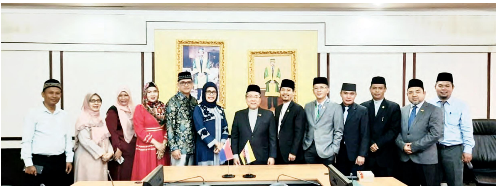
ROMBONGAN Mindanao State University, Tawi-Tawi College of Technology and Oceanography (MSU - TCTO), Republik Filipina ketika sesi bergambar ramai bersama rombongan Universiti Islam Sultan Sharif Ali (UNISSA).

Hadir menyaksikan penandatanganan MOU tersebut, Timbalan Rektor, Penolong Rektor UNISSA, beberapa Pegawai-pegawai Utama UNISSA dan seramai lima orang delegasi daripada MSU - TCTO.