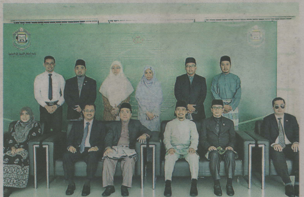
Warga UNISSA bergambar ramai dengan rombongan UIM.

BANDAR SERI BEGAWAN, 18 Feb - Universiti Islam Sultan Sharif Ali (UNISSA), hari ini, telah menerima kunjungan rombongan dari Universiti Islam Malaysia (UIM) dalam rangka untuk mengadakan koordinasi dan kolaborasi setelah termeterainya memorandum persefahaman (MoU) yang telah ditandatangani pada 27 Mei 2015 di UNISSA.