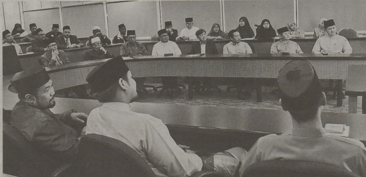
Antara yang hadir pada majlis tersebut.

Disamping segmen perbualan ini, buku itu juga mengandungi pelbagai doa dan glosari perkataan bagi rujukan para jemaah haji dan umrah serta penziarah. Buku tersebut disertakan de-