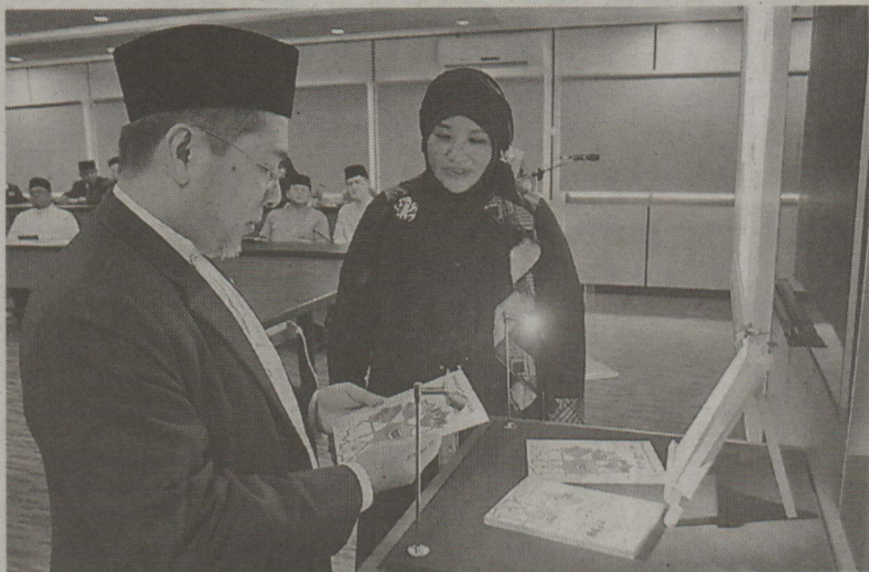
Tetamu kehormat ketika merasmikan pelancaran buku panduan berkenaan.