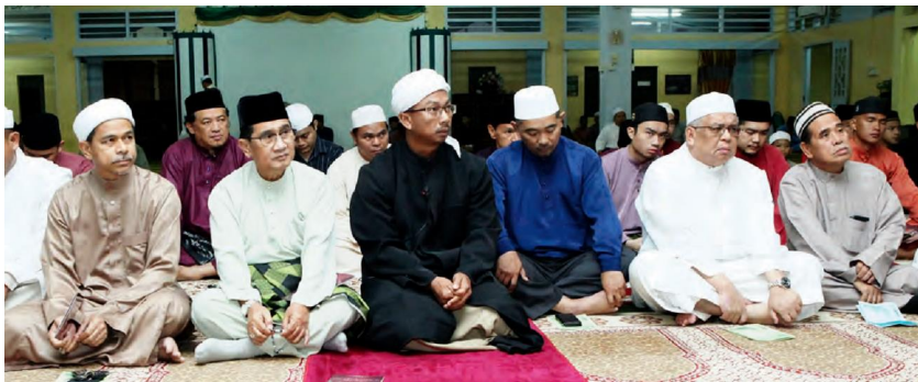
TIMBALAN Menteri Hal Ehwal Ugama, Yang Mulia Pengiran Dato Seri Paduka Haji Bahrom bin Pengiran Haji Bahar; Ahli Majlis Mesyuarat Negara, Yang Berhormat Awang Haji Emran bin Haji Sabtu dan Pegawai Daerah Temburong, Awang Mohammad Amir Hairil bin Awang Haji Mahmud antara yang hadir di majlis tersebut.

Usaha seumpama ini dilaksanakan adalah untuk meningkatkan keramaian jemaah menunaikan Sembahyang Fardu Subuh secara berjemaah di samping memakmurkan rumah Allah dengan memaikaikan kehadiran jemaah mendirikan sembahyang secara berjemaah, seperti petikan hadis yang diriwayatkan oleh Al-Bukhari, sembahyang berjemaah itu lebih afdal daripada sembahyang berseorangan dengan kelebihan 27 darjat.