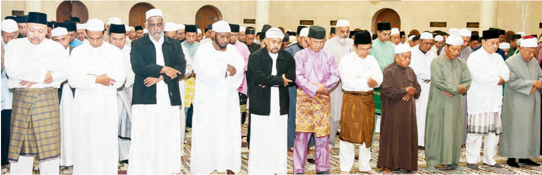
MENTERI Hal Ehwal Dalam Negeri; Menteri Hal Ehwal Ugama; Menteri Sumber-Sumber Utama dan Pelancongan; Menteri Perhubungan dan Menteri Kebudayaan, Belia dan Sukan serta Mufti Kerajaan di antara yang hadir Sembahyang Fardu Subuh Berjemaah yang turut diadakan di Jame' 'Asr Hassaniil Bolkiah bagi menyemarakkan Sambutan Israk dan Mikraj Peringkat Negara Tahun 1439 Hijrah.