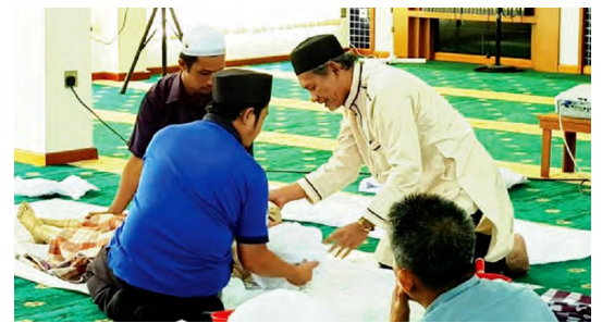
ANTARA perisian Bengkel Aplikasi Mazhab Syafi'i, iaitu Pengurusan Jenazah Kali Ke-2.