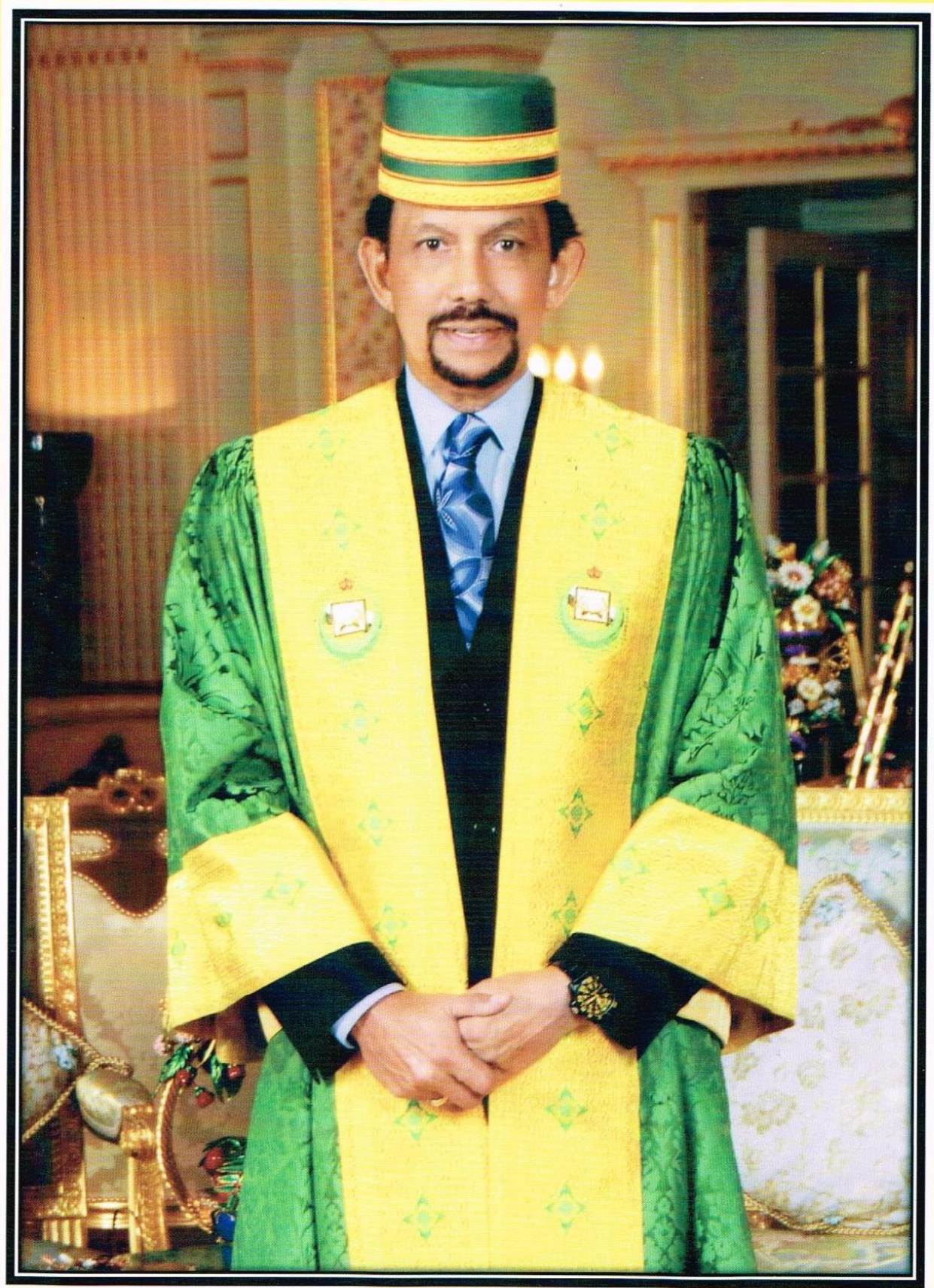
KEBAWAH DULI YANG MAHA MULIA PADUKA SERI BAGINDA SULTAN HAJI HASSANAL BOLKIAH MU'IZZADDIN WADDAULAH IBNI AL-MARHUM SULTAN HAJI OMAR 'ALI SAIFUDDIEN SA'ADUL KHAIRI WADDIEN, SULTAN DAN YANG DI-PERTUAN NEGARA BRUNEI DARUSSALAM

CANSELOR UNIVERSITI ISLAM SULTAN SHARIF ALI