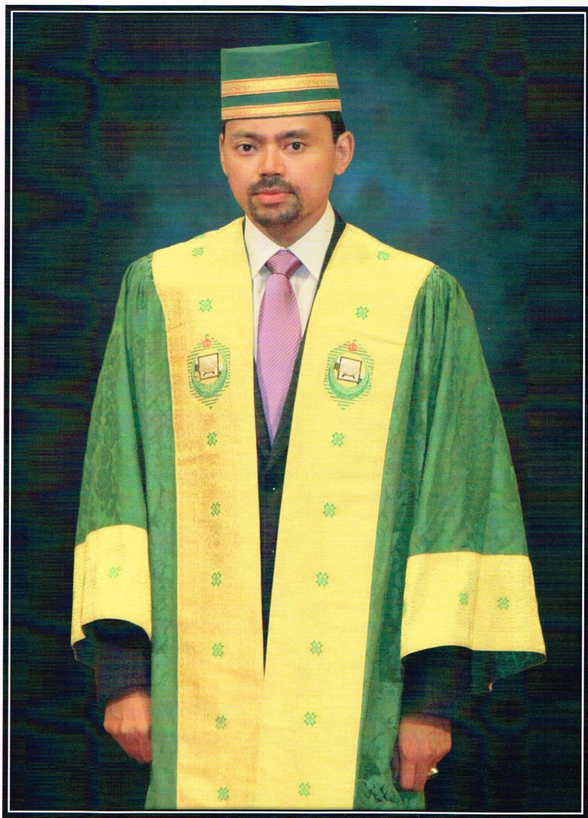
DULI YANG TERAMAT MULIA PADUKA SERI PENGIRAN MUDA MAHKOTA PENGIRAN MUDA (DR.) HAJI AL-MUHTADEE BILLAH IBNI KEBAWAH DULI YANG MAHA MULIA PADUKA SERI BAGINDA SULTAN HAJI HASSANAL BOLKIAH MU'IZZADDIN WADDAULAH, MENTERI KANAN DI JABATAN PERDANA MENTERI

PRO-CANSELOR UNIVERSITI ISLAM SULTAN SHARIF ALI