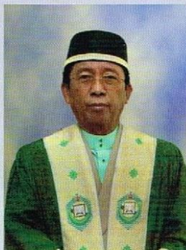
Yang Berhormat Pengiran Dato Seri Setia Dr Haji Mohammad bin Pengiran Haji Abdul Rahman