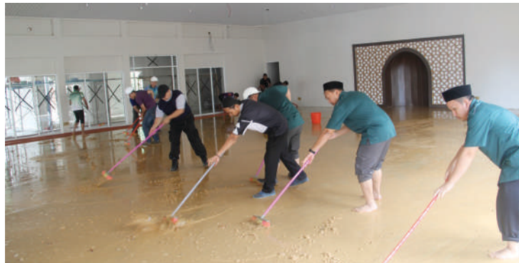
Pegawai dan kakitangan lelaki begotong-royong menyertu surau UNISSA.

Universiti Islam Sultan Sharif Ali (UNISSA) telah mengadakan acara menyertu bagi Surau Universiti pada 2 Rejab 1438H bersamaan 30 Mac 2017M. Amalan ini bertujuan bagi membersihkan najis agar jemaah tidak merasa was-was semasa mengerjakan ibadah di dalam surau berkenaan.