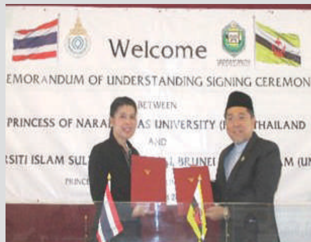
Memorandum Persefahaman antara UNISSA dan Princess Of Naradhiwas University (PNU), Thailand.

Pada 29 Jamadilakhir 1438H bersamaan 28 Mac 2017M, Universiti Islam Sultan Sharif Ali (UNISSA) telah meluaskan jalinan kerjasama strategik dengan institusi pengajian tinggi luar negara dengan termeterainya penandatanganan Memorandum Persefahaman (MoU) antara UNISSA dengan dua buah universiti di Thailand iaitu Princess of Naradhiwas University (PNU) dan juga Jami'ah Islam Sheikh Daud Al-Fathani (JISDA). Menandatangani bagi pihak UNISSA ialah Dr Haji