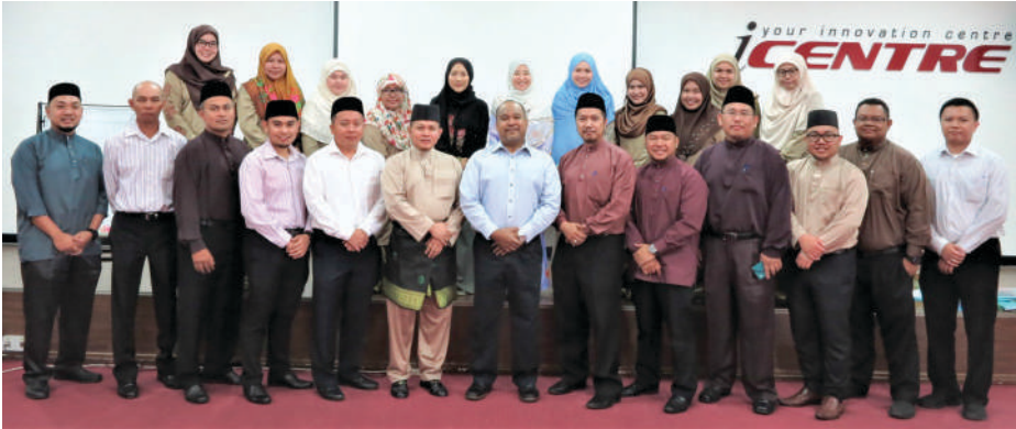
Gambar ramai Pegawai-Pegawai UNISSA bersama fasilitator kursus.

Pada hari kedua dan ketiga pula, para pegawai telah diberikan kursus 'Developing Team Members- Key Leadership Attribute' bertempat di iCentre, BEDB, Berakas. Seterusnya pada hari terakhir kursus pula, mereka telah menjalani program 'Problem Solving & Decision Making: Key Leadership Attribute' yang diadakan di tempat yang sama.