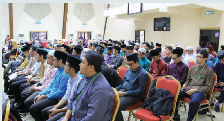
Para mahasiswa dan mahasiswi Tahun Pertama telah menghadiri kuliah berkenaan di Auditorium, UNISSA.