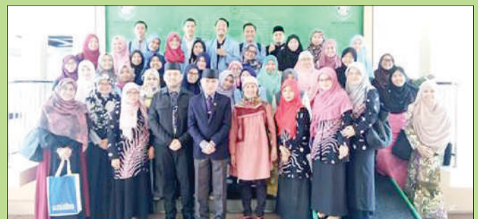
Gambar ramai delegasi Fakultas Ekonomi dan Bisnis, Universiti Islam Bandung (UNISBA) yang membuat lawatan ke UNISSA.

Fakulti Ekonomi dan Kewangan Islam (FEKIm), Universiti Islam Sultan Sharif Ali (UNISSA), telah menerima kunjungan delegasi dari Fakultas Ekonomi dan Bisnis, Universiti Islam Bandung (UNISBA), Indonesia pada 16 Jamadilawal 1438H bersamaan 13 Februari 2017M bertempat di Bilik Latihan L1.2 UNISSA.