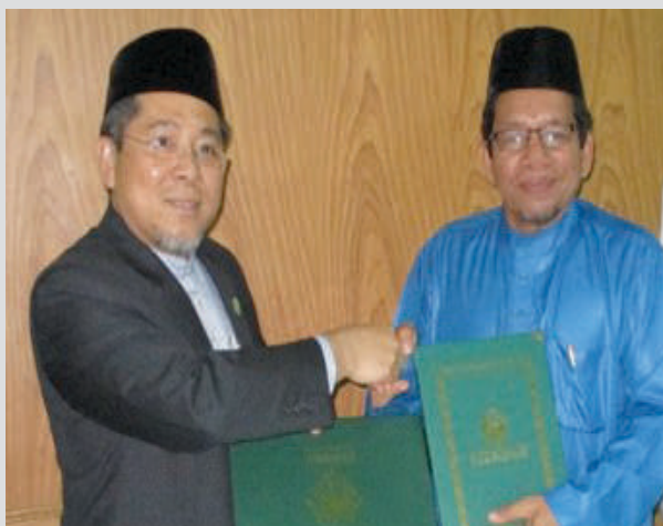
Penandatanganan Memorandum Persefahaman Antara UNISSA dan Jami'ah Islam Sheikh Daud Al-Fathani (JISDA), Thailand.