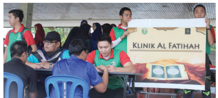
'Klinik Al-Fatihah' yang dikendalikan oleh pelajar UNISSA.