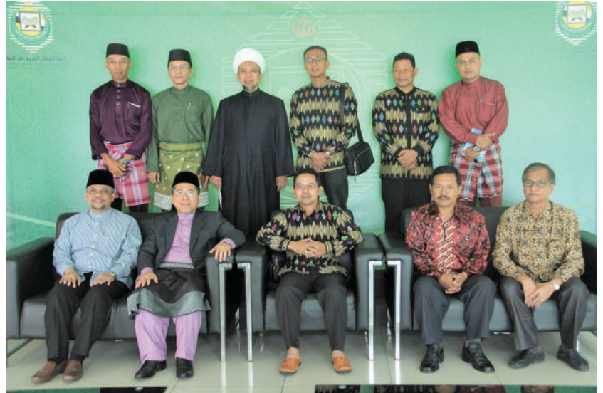
Bergambar ramai bersama delegasi STAIN Bengkalis, Riau ke UNISSA.