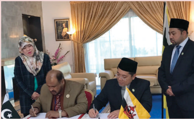
Penandatanganan Memorandum Persefahaman Antara UNISSA dan International Islamic University Islamabad, Pakistan