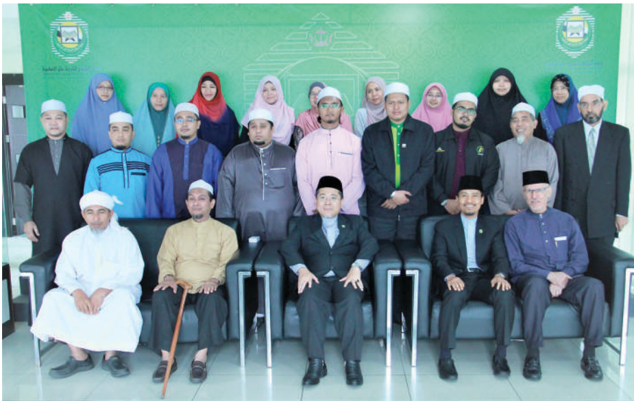
Bergambar ramai bersama rombongan daripada Yayasan Mujamma' Darul Hadis (YAMDAH) ke UNISSA.