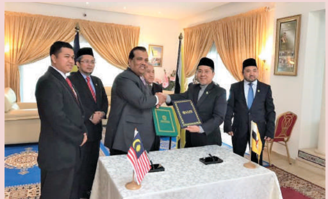
Penandatanganan Memorandum Persefahaman Antara UNISSA dan Universiti Utara Malaysia (UUM), Malaysia.