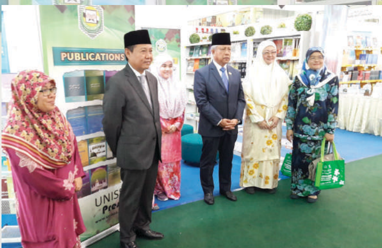
Yang Berhormat Pehin Datu Lailaraja Mejar Jeneral (B) Dato Paduka Seri Haji Awang Halbi bin Haji Mohd. Yussof (tiga dari kanan), Menteri Kebudayaan, Belia dan Sukan berkunjung ke petak jualan UNISSA Press.

Pihak Universiti Islam Sultan Sharif Ali (UNISSA Press) telah menyertai Pesta Buku Brunei 2017 anjuran Dewan Bahasa dan Pustaka (DBP), Kementerian Kebudayaan, Belia dan Sukan yang telah diadakan selama 10 hari bermula 29 Jamadilawal hingga 8 Jamadilakhir 1438H bersamaan 26 Februari hingga 7 Mac 2017M.