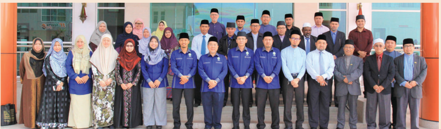
Sesi Retreat bagi Pegawai-Pegawai Utama UNISSA yang berlangsung selama dua hari di V-Plaza Hotel, Kuala Belait.

Universiti Islam Sultan Sharif Ali (UNISSA) melalui Unit Jaminan Kualiti mengadakan satu sesi retreat bagi Pegawai-Pegawai Utama UNISSA bagi membincangkan rangka Pelan Strategik UNISSA serta memastikan hala tuju pentadbiran dan juga akademik UNISSA dapat dilaksanakan dengan lebih teratur dan berkesan di samping mengambil peluang untuk membincangkan isu-isu yang dihadapi