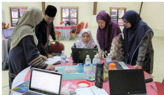
Peserta bengkel sedang membuat perbincangan.