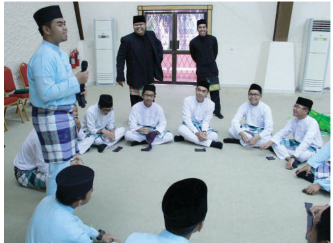
Mahasiswa dan mahasiswi dari Fakulti Usuluddin Tahun 3 sedang mengungkayahkan Projek Dakwah kepada peserta terdiri daripada penuntut-penuntut sekolah Arab.

Kira-kira 90 orang peserta terdiri dari Sekolah Menengah Arab Laki-Laki Hassanal Bolkiah, Sekolah Ugama Arab Menengah Perempuan Raja Isteri Pengiran Anak Damit dan Sekolah Ugama Arab Menengah Perempuan Raja Isteri Pengiran Anak Hajah Saleha menyertai program tersebut.