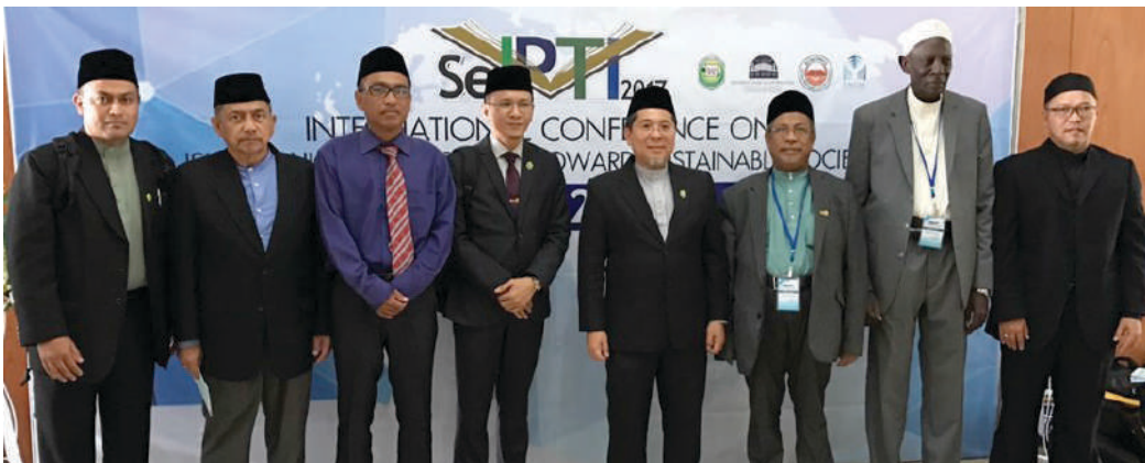
Antara ahli-ahli akademik UNISSA yang menghadiri Seminar SeIPTI dan membentangkan kertas kerja.