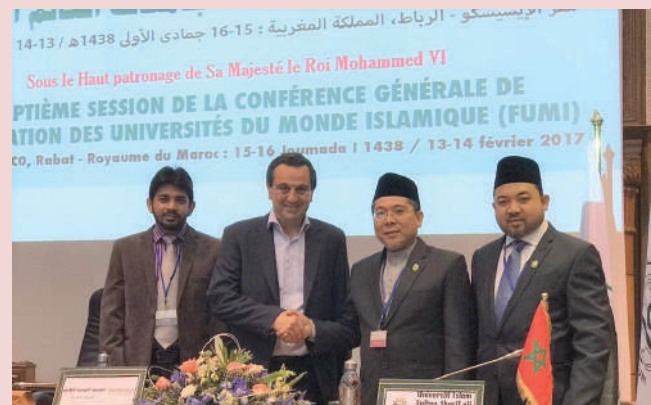
Penandatanganan Memorandum Persefahaman Antara UNISSA dan International University of Agadir, Maghribi