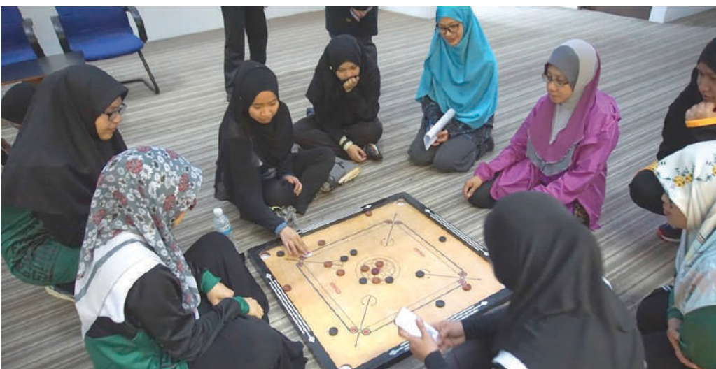
Perlawanan indoor games bagi pensyarah dan mahasiswi bahagian perempuan.