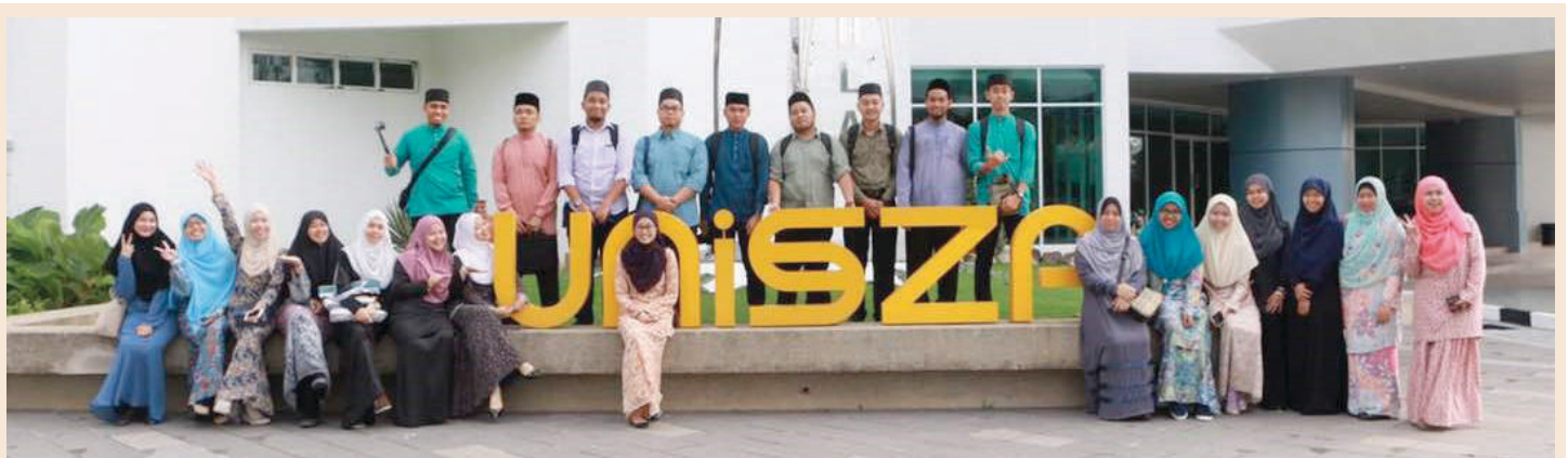
Rombongan pelajar Fakulti Syariah dan Undang-Undang, UNISSA membuat lawatan ilmiah selama seminggu ke universiti-universiti di Malaysia, di antaranya ialah Universiti Sultan Zainal Abidin (UniSZA) di Terengganu, Malaysia.