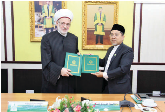
Penandatanganan Memorandum Persefahaman Antara UNISSA dan Bilad Al-Syam University (BSU), Syria.

Universiti Islam Sultan Sharif Ali (UNISSA) terus bergiat aktif menjalankan kerjasama strategik dengan institusi pengajian tinggi luar negara melalui penandatanganan memorandum persefahaman (MoU) dengan Bilad Al-Syam University (BSU), Syria dalam usaha meningkatkan reputasi di arena antarabangsa. Majlis penandatanganan MoU berkenaan telah berlangsung pada 25 Rabiulakhir 1438H bersamaan 23 Januari 2017M