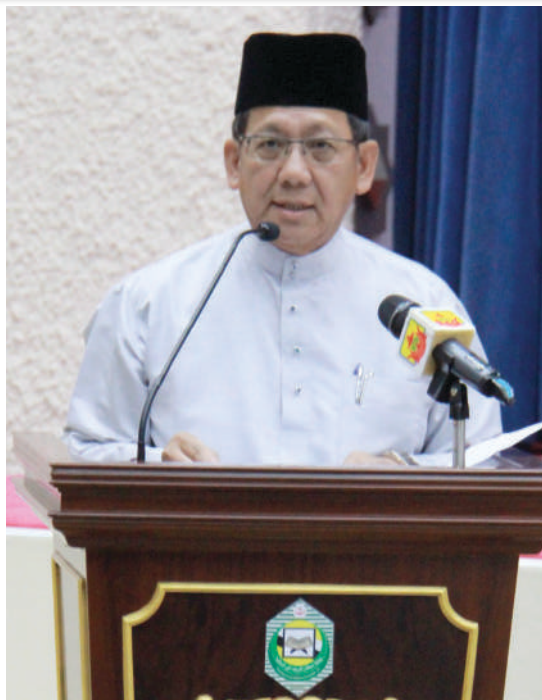
Yang Berhormat Pehin Orang Kaya Indera Pahlawan Dato Seri Setia Haji Suyoi bin Haji Osman, Menteri Pendidikan (kiri) memberi ucapan semasa Majlis Kesyukuran Penubuhan UNISSA ke-10 tahun.

Titah Sempena Majlis Hafiz Al-Takharruj ke-6 2016 UNISSA pada hari Sabtu, 20 Muharram 1438 / 22 Oktober 2016