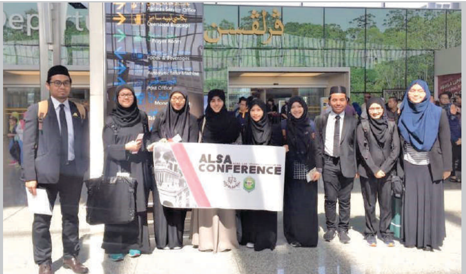
UNISSA students departed to Bandung, Indonesia to participate in the Asian Law Students' Association Conference (ALSA Conference).

Eight law students from Universiti Islam Sultan Sharif Ali (UNISSA) left for Bandung, Indonesia on 17 Rabiulakhir 1438H corresponding to 15 January 2017M to participate in the Asian Law Students' Association Conference (ALSA Conference).