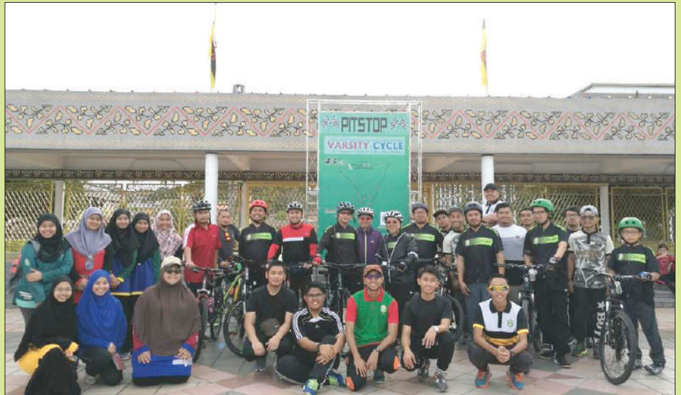
A group photo of UNISSA participants during the Varsity Cycle event held at Bandar Seri Begawan.

In conjunction with the 43 rd birthday of His Royal Highness Prince Haji Al-Muhtadee Billah ibni His Majesty Sultan Haji Hassanal Bolkiah Mu'izzaddin Waddaulah, the Crown Prince and Senior Minister at the Prime Minister's Office and Pro-Chancellor of Universiti Brunei Darussalam (UBD), Universiti Islam Sultan Sharif Ali (UNISSA), and Universiti Teknologi Brunei (UTB), 'Varsity Cycle', a charitable cycling expedition for the Pengiran Muda Mahkota Al-Muhtadee Billah Fund for Orphans (DANA) was held on 22 Jamadilawal 1438H corresponding to 19 February 2017M at UTB.