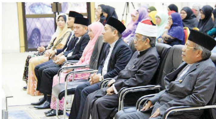
Para tetamu khas semasa Kuliah Khas berkenaan.