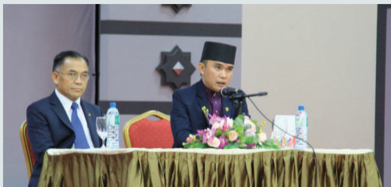
Kuliah Khas MIB yang disampaikan oleh Yang Berhormat Dato Seri Setia Awang Haji Ali bin Haji Apong, Menteri Sumber-Sumber Utama dan Pelancongan (kiri).