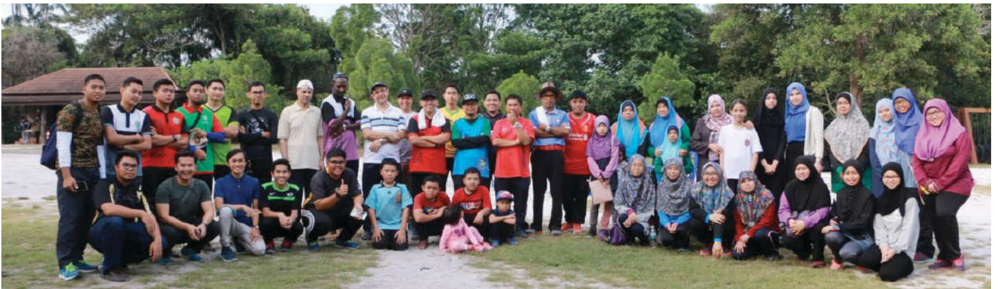
Gambar ramai warga Fakulti Syariah dan Undang-Undang UNISSA bersama ahli keluarga semasa acara Hari Keluarga yang diadakan di Taman Rekreasi Hutan Berakas.