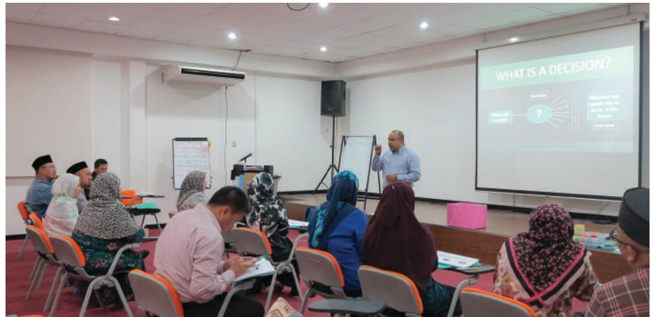
Pegawai-pegawai UNISSA sedang menghadiri kursus yang diadakan di iCentre BEDB, Berakas.

Hari pertama kursus telah berlangsung di Pusat Sukan Air Angkatan Bersenjata Diraja Brunei (ABDB), Serasa. Kursus "Team Building" bagi penolong-penolong pendaftar dan pegawai-pegawai berkenaan juga turut disertai oleh Pegawai-Pegawai Eksekutif UNISSA.