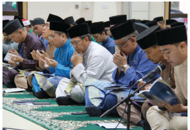
Majlis Kesyukuran sempena Ulang Tahun yang ke-10 UNISSA telah diadakan di Auditorium, UNISSA.