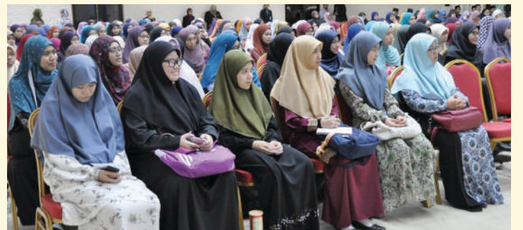
Pelajar UNISSA yang menghadiri Program Kurapak Kitani Siri ke-5.