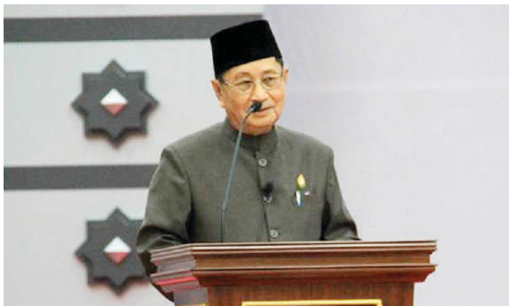
Kuliah Khas MIB yang disampaikan oleh Yang Berhormat Pehin Udana Khatib Dato Paduka Seri Setia Ustaz Haji Awang Badaruddin bin Pengarah Dato Paduka Haji Othman, Menteri Hal Ehwal Agama.