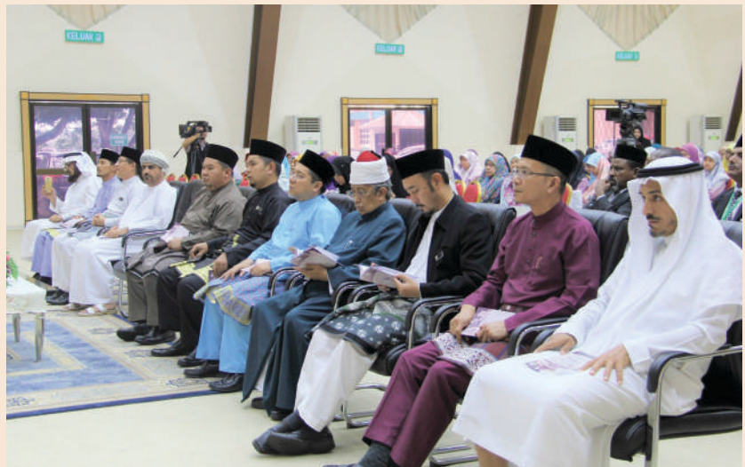
Para tetamu kehormat yang hadir semasa Majlis Penutup Persidangan Antarabangsa Pengajaran Bahasa Arab Asia Tenggara.