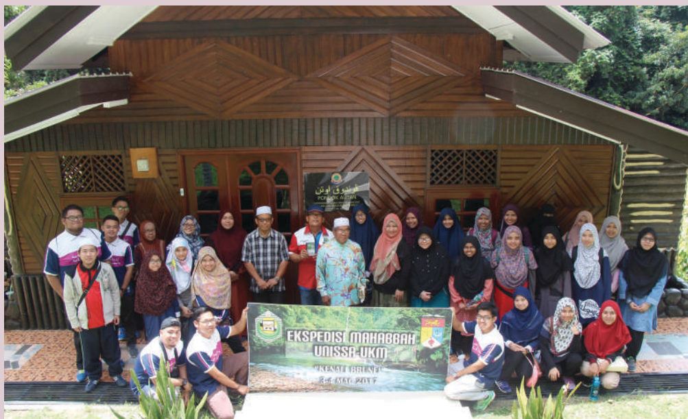
A group photo of UNISSA and UKM expedition with the Village Head of Kampong Belais, Temburong.

Universiti Islam Sultan Sharif Ali (UNISSA), through its Faculty of Arabic Language (FAL) and Faculty of Islamic Development Management with the cooperation of Student Mobility of Islamic Institution Faculty, Universiti Kebangsaan Malaysia (UKM), held an expedition titled ' Kenali Brunei ' with the theme ' Jalinan Mahabbah, Mempererat Ukhuwah '.