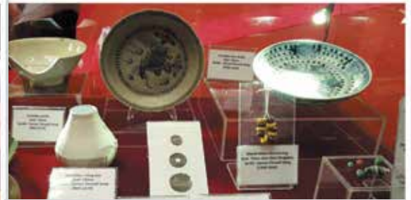
Pameran-pameran sepanjang Mahrajan Hafl Al-Takharruj ke-6