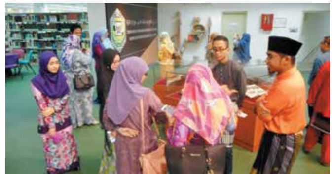
Rombongan diberikan penerangan tentang Perpustakaan UNISSA