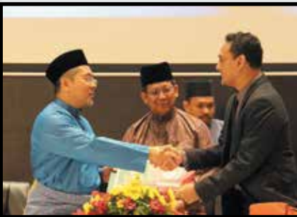
MoU bersama Kolej Universiti Islam Melaka (KUIM)