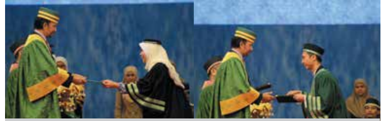
His Majesty in his capacity as the Chancellor of UNISSA presenting the certificates to the graduates

219 graduates of Universiti Islam Sultan Sharif Ali (UNISSA) received their certificates from His Majesty Sultan Haji Hassanal Bolkiah Mu'izzaddin Waddaulah ibni Al-Marhum Sultan Haji Omar 'Ali Saifuddien Sa'adul Khairi Waddien, Sultan and Yang Di-Pertuan of Brunei Darussalam and Chancellor of UNISSA, at the 6 th UNISSA Convocation held on 22 October 2016 at the International Convention Centre (ICC) in Berakas. Accompanying the monarch was His Royal Highness Prince Haji Al-Muhtadee Billah, the Crown Prince and Senior Minister at the Prime Minister's Office and Pro-Chancellor of UNISSA.