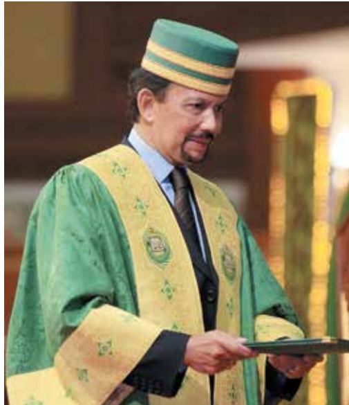
Kebawah Duli Yang Maha Mulia Paduka Seri Baginda Sultan Haji Hassanal Bolkiah Mu'izzaddin Waddaulah ibni Al-Marhum Sultan Haji Omar 'Ali Saifuddien Sa'adul Khairi Waddien, Sultan dan Yang Di-Pertuan Negara Brunei Darussalam berkenan menghadiri Majlis Hafal Al-Takharruj Universiti Islam Sultan Sharif Ali (UNISSA) Kali ke-6 di Pusat Persidangan Antarabangsa (ICC), Berakas.

yang betul dan tepat mengenai agama Islam.