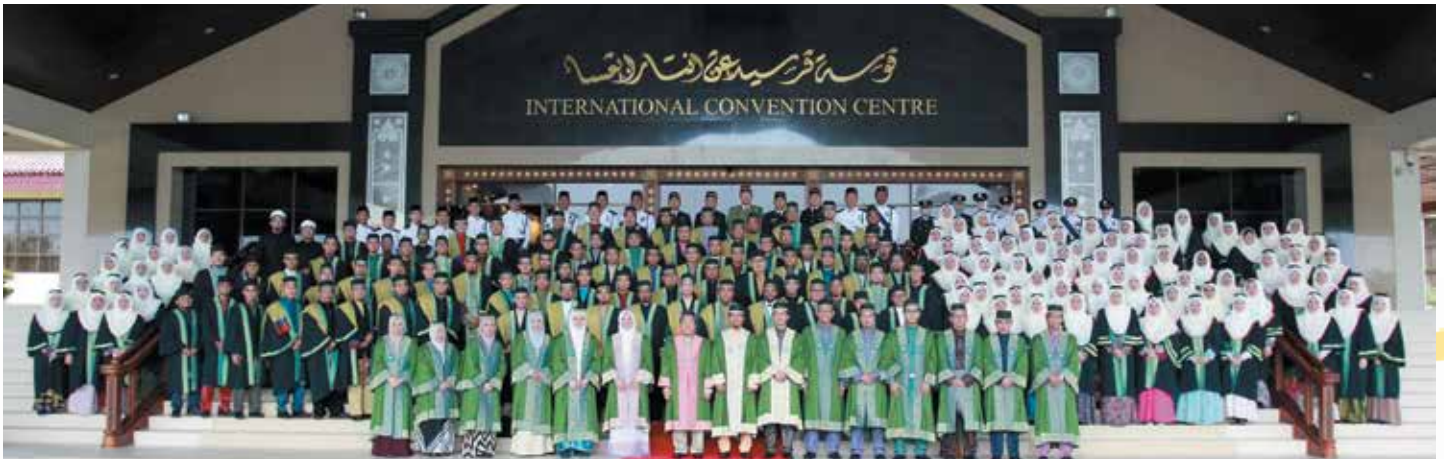
Group photos of graduates of UNISSA with the key executive officers of UNISSA

Faculty of Syariah and Law this year produced 10 first graduates who pursued a Double Degree programme in Bachelor of Law and Bachelor of Syariah Law for five years, while 26 others completed their studies in the Syariah Crime Justice System Certificate programme.