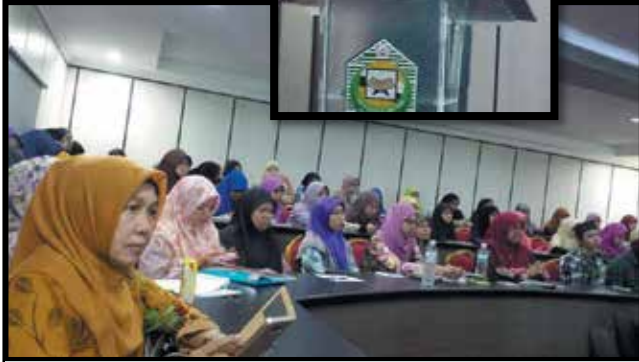
Lecturers and students attending the talk