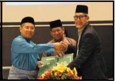
MoU bersama Kolej Pengajian Islam Johor (MARSAH)