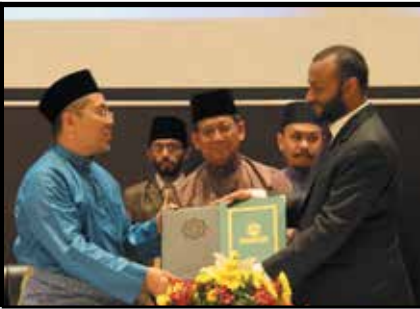
MoU bersama Islamic University of Maldives