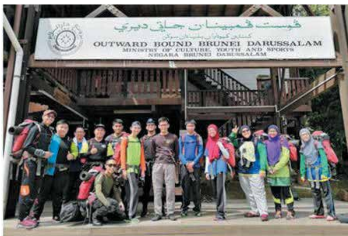
Gambar ramai ahli MPP UNISSA

Seramai 23 orang ahli MPP UNISSA telah berjaya menamatkan Kursus Sekapur Sireh di Pusat Outward Bound Brunei Darussalam, Temburong. Sepanjang kursus tiga hari tersebut, pelajar membina pengalaman mengikuti pelbagai aktiviti, termasuk kayak, 'flying fox', aktiviti 'team building' dan 'jungle trekking'.