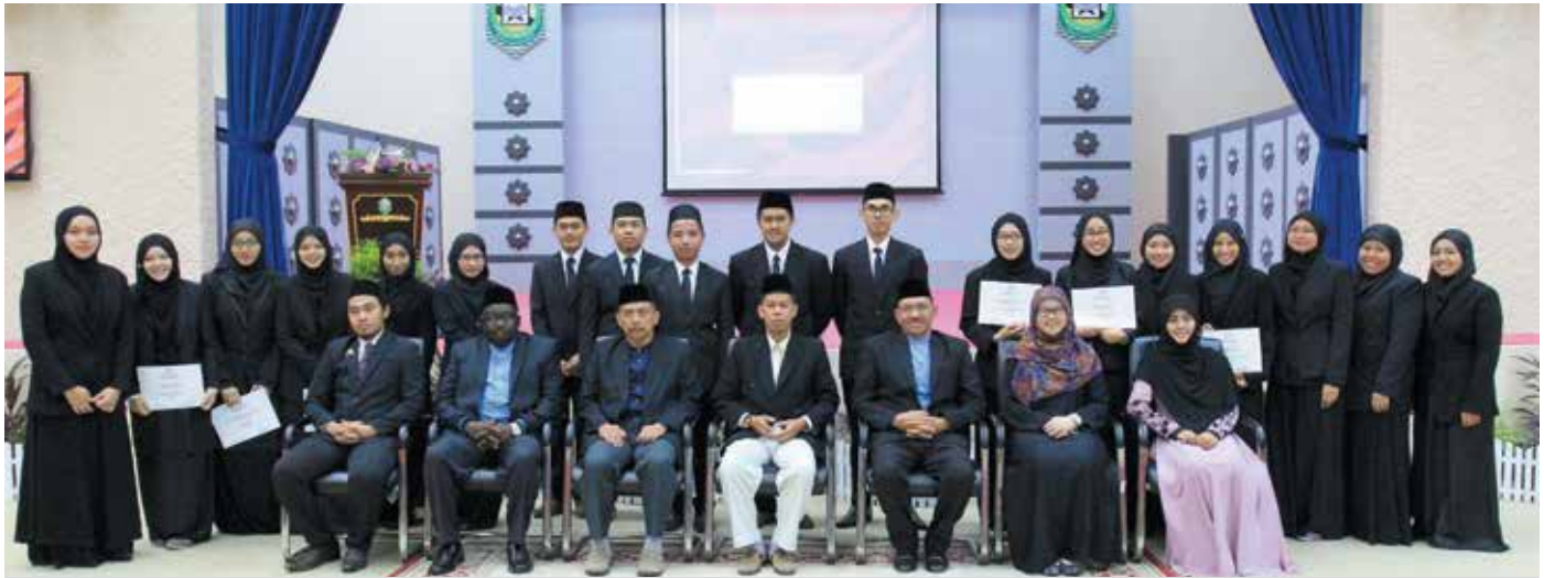
The new ALSA Brunei board members with the lecturers of Faculty of Syariah and Law UNISSA