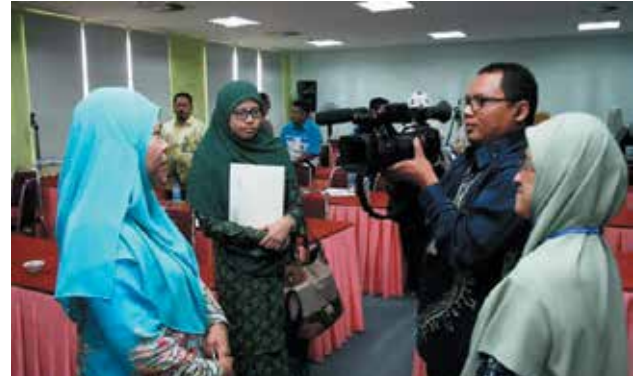
Pustakawan Kanan UNISSA ketika diwawancara oleh pihak USIM