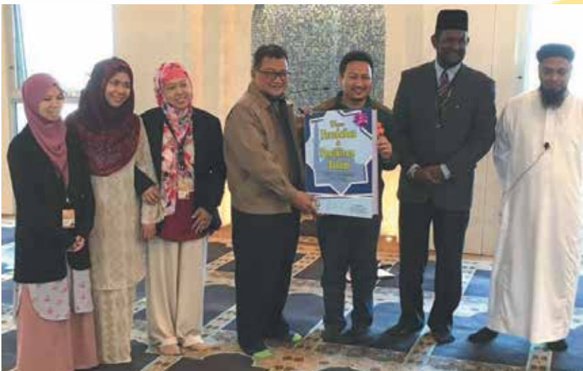
Pelancaran Buku "Wacana Peradaban dan Pemikiran Islam: Interaksi dan Sumbangan Nusa Bangsa" hasil terbitan kolaborasi antara Universiti Islam Sultan Sharif Ali (UNISSA) dan Kolej Universiti Islam Antarabangsa Selangor (KUIS) di Masjid Ibrahim, Perth, Australia