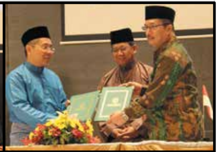
MoU bersama Universitas Islam Negeri Fatah Palembang (UIN)