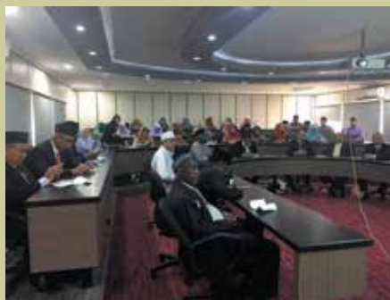
Pensyarah yang hadir mendengarkan ceramah