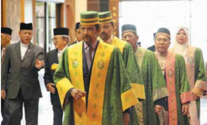
His Majesty Sultan Haji Hassanal Bolkiah Mu'izzaddin Waddaulah ibni Al-Marhum Sultan Haji Omar 'Ali Saifuddien Sa'adul Khairi Waddien, Sultan and Yang Di-Pertuan of Brunei Darussalam and Chancellor of UNISSA, at the 6 th UNISSA Convocation

219 graduates of Universiti Islam Sultan Sharif Ali (UNISSA) received their certificates from His Majesty Sultan Haji Hassanal Bolkiah Mu'izzaddin Waddaulah ibni Al-Marhum Sultan Haji Omar 'Ali Saifuddien Sa'adul Khairi Waddien, Sultan and Yang Di-Pertuan of Brunei Darussalam and Chancellor of UNISSA, at the 6 th UNISSA Convocation held on 22 October 2016 at the International Convention Centre (ICC) in Berakas. Accompanying the monarch was His Royal Highness Prince Haji Al-Muhtadee Billah, the Crown Prince and Senior Minister at the Prime Minister's Office and Pro-Chancellor of UNISSA.