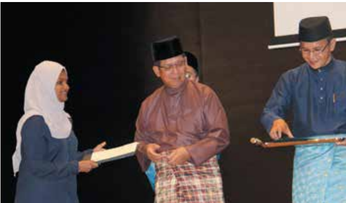
Tetamu Kehormat menyampaikan hadiah kepada Penerima Pingat Universiti

Pada hari Sabtu, 22 Oktober 2016, Majlis Makan Malam bagi meraikan graduan-graduan UNISSA sempena Hafl Al-Takharruj Ke-6 telah diadakan di Dewan Serambi Suluh, Tarindak D'seni, Pusat Latihan Kesenian dan Pertukangan Tangan Brunei. Hadir selaku tetamu kehormat dan seterusnya menyempurnakan penyampaian pingat dan hadiah-hadiah kepada para graduan ialah Menteri Pendidikan, Yang Berhormat Pehin Orang Kaya Indera Pahlawan Dato Seri Setia Awang Haji Suyoi bin Haji Osman.