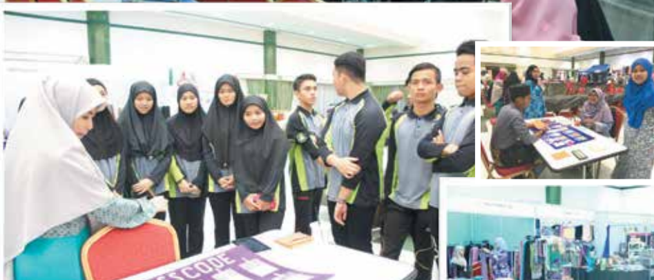
Pertandingan dan permainan 'games' bagi murid-murid sekolah rendah, menengah dan maktab yang dikendalikan oleh pelajar Fakulti Ekonomi dan Kewangan Islam (FEKIm), UNISSA pada 12-16 Oktober 2016M