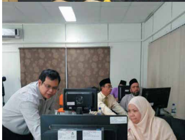
Sesi demonstrasi bagi Springer , Credo & Oxford Databases