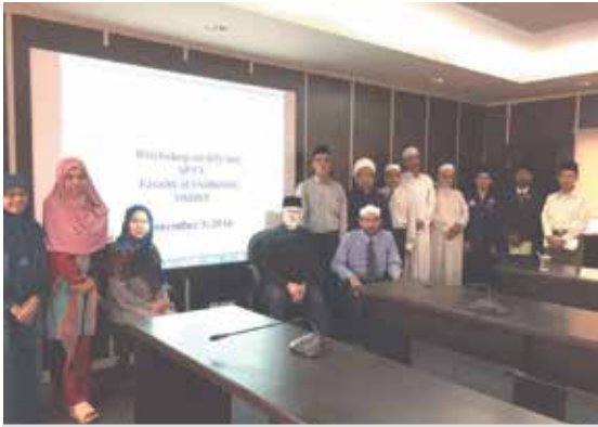
Tenaga akademik Fakulti Usuluddin yang menyertai Bengkel KPI SPTA anjuran Fakulti Usuluddin, UNISSA

mengadakan Bengkel KPI SPTA bagi tenaga akademik fakulti berkenaan. Bengkel tersebut telah diadakan pada hari Sabtu, 3 Rabiulawal 1438H bersamaan dengan 3 Disember 2016M bertempat di Bilik Mesyuarat L1.2 UNISSA.