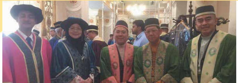
From Right: Minister of Health and Minister of Education with the Rector of UIAM & Assistant Rector KUIM Melaka

HafI al-Takharruj also received attendance from 19 representatives from foreign universities. These include Chancellor / President / Vice Chancellor and the University Rector of the Islamic University of Maldives, Universiti Al al-Bayt University Jordan (AABU), Islamic University of Gaza (IUG), Darul Huda Islamic Universiti Kerala India, Universiti Islam Karzakhstan, Universiti Islam Antarabangsa Malaysia (UIAM), Universiti Islam Malaysia (UIM), Universiti Kebangsaan Malaysia (UKM), Universiti Pendidikan Sultan Idris