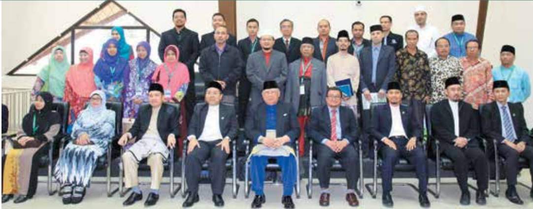
Group Photo: Deputy Minister of Religious Affairs with the Committee members

The Deputy Minister of Religious Affairs called on youths to carry out more research on Islam for further development of religious studies in the sultanate.