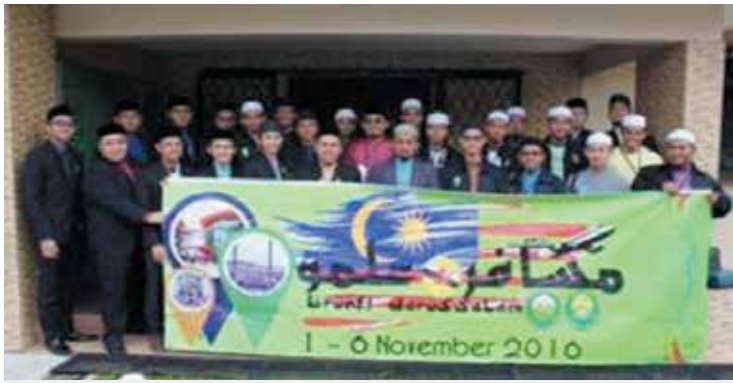
Gambar ramai rombongan PMKIAS

Universiti Islam Sultan Sharif Ali (UNISSA) melalui Hal Ehwal Pelajar (HEP) telah menerima kunjungan lawatan muhibah daripada Persatuan Mahasiswa Kolej Islam Antarabangsa Sultan Ismail Petra (PMKIAS), Kelantan pada 1 November 2016 hingga 6 November 2016.