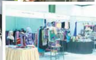
Petak jualan 'cube' dan buku-buku terbitan UNISSA Press