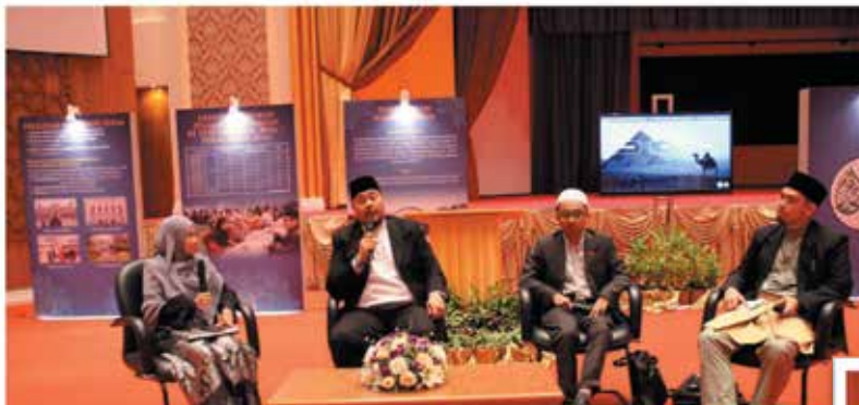
Forum 'Talk on Islamic Finance' yang diadakan pada 14 Oktober 2016M