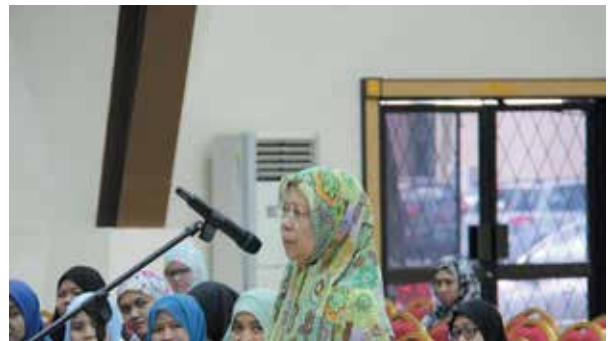
Peserta kuliah sedang mengemukakan soalan

Fakulti Usuluddin telah mengadakan Kuliah Umum “ Liqa’ Ilmy ” Fakulti Usuluddin yang berlangsung di Dewan Auditorium UNISSA pada 5 Oktober 2016. Antara isu yang diketengahkan adalah isu permasalahan global iaitu penyalahgunaan dadah.