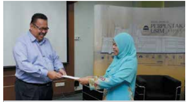
Pustakawan Kanan UNISSA menerima sijil penyertaan daripada Ketua Perpustakaan USIM

Kertas kerja ini adalah mengenai cadangan penubuhan konsortium perpustakaan Islam di Negara Brunei Darussalam yang mana bertujuan untuk berkongsi sumber perpustakaan Islam bagi meningkatkan pengguna dan penggunaan bahan-bahan tersebut, mendedahkan dan memberigakan lagi koleksi dan perkhidmatan yang ditawarkan oleh perpustakaan-perpustakaan Islam di Negara Brunei Darussalam.