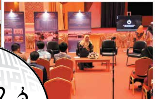
Forum 'Islamic Entrepreneurship' yang diadakan pada 12 Oktober 2016M