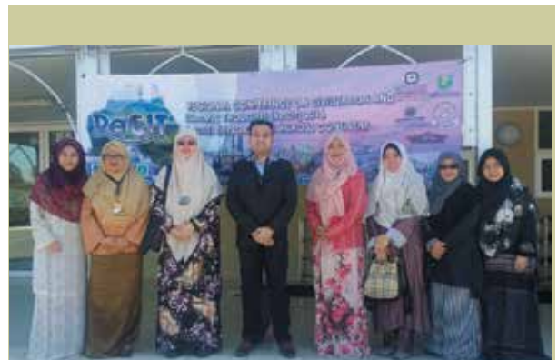
Tenaga Akademik UNISSA menghadiri Seminar Serantau Peradaban dan Pemikiran Islam (ReCIT 2016) di Masjid Ibrahim, Perth, Australia

The objective of this conference is to discuss and determine the feasible system that can improve the quality of Islamic higher education. This is to ensure that the system does not incline towards Western ways. Rather the system should possess an individual unique quality islamically. At the end, this can lead to a more highly skilled and quality graduates.