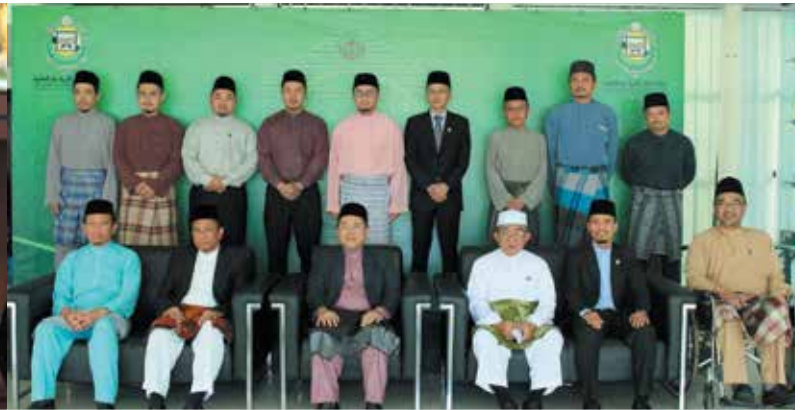
Gambar ramai pegawai UNISSA bersama pegawai dari Jabatan Mufti