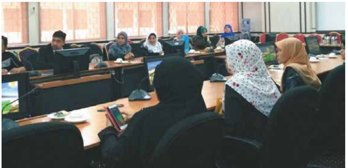
Rombongan lawatan ketika diberi taklimat oleh YM Pustakawan Kanan di Bilik Senat, UNISSA

Seramai 17 ahli Persatuan Pustakawan Malaysia (PPM) berada di Brunei bagi lawatan tiga hari bermula dari 28-30 Oktober 2016M untuk melihat dengan lebih dekat lagi pengurusan perpustakaan-perpustakaan di Brunei, terutamanya koleksi bahan-bahan undang-undang. PPM mempunyai lebih daripada 60 tahun penubuhannya dengan pelbagai pencapaian. Mereka berada di Brunei sebagai tetamu Persatuan