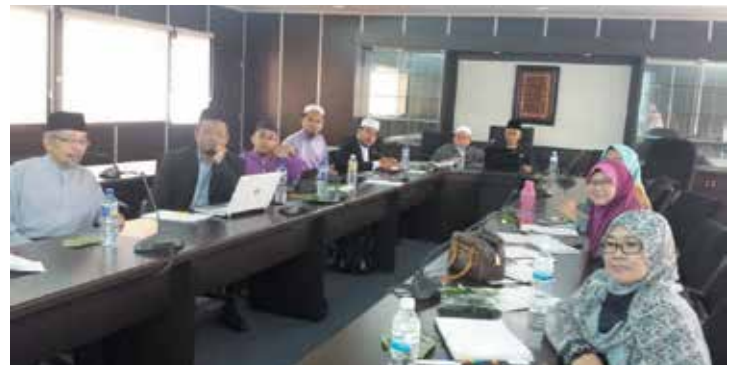
Sesi perbincangan ahli akademik Pusat Kajian Pengurusan Pembangunan Islam (ISDEV) bersama UNISSA