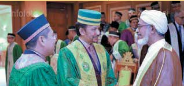
His Majesty with Rector of Darulhuda Islamic University Kerala India (right) and Rector of UNISSA (left)