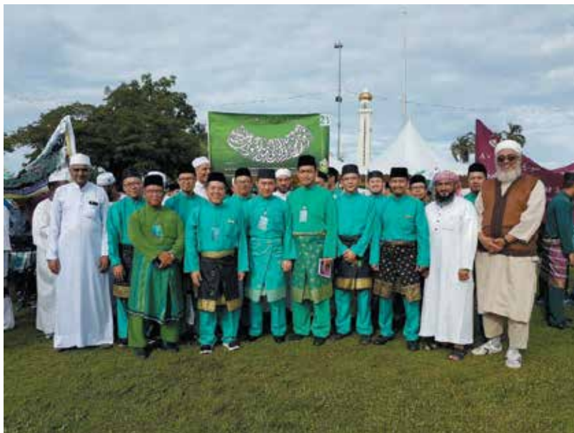
Pasukan UNISSA yang menyertai perarakan

Pada 12 Rabiulawal 1438H bersamaan 12 Disember 2016M, Universiti Islam Sultan Sharif Ali (UNISSA) seperti lazimnya berpeluang untuk menyertai perarakan sempena sambutan Maulud Nabi Muhammad Sallallahu 'Alaihi Wasallam. Acara ini telah diadakan di Taman Sir Muda Omar Ali Saifuddien di Bandar Seri Begawan.