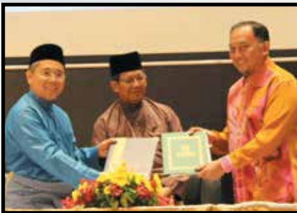
MoU bersama Universiti Kebangsaan Malaysia (UKM)