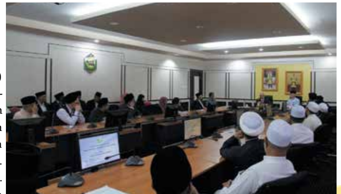
Pensyarah yang hadir mendengarkan ceramah