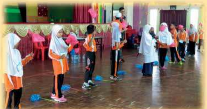
Antara aktiviti Program Tunas Harapan 2016 yang berlangsung di Sekolah Rendah Rimba I