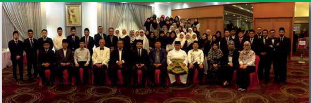
Ketua Hakim Negara bersama para jemputan Majlis 'Law Dinner' UNISSA

Universiti Islam Sultan Sharif Ali (UNISSA) melalui Fakulti Syariah dan Undang-Undang (FSU) telah mengadakan Majlis Makan Malam Undang-Undang atau 'Law Dinner' pada 26 Sya'ban 1437 bersamaan dengan 2 Jun 2016, bertempat di Hotel Parkview, Jerudong.