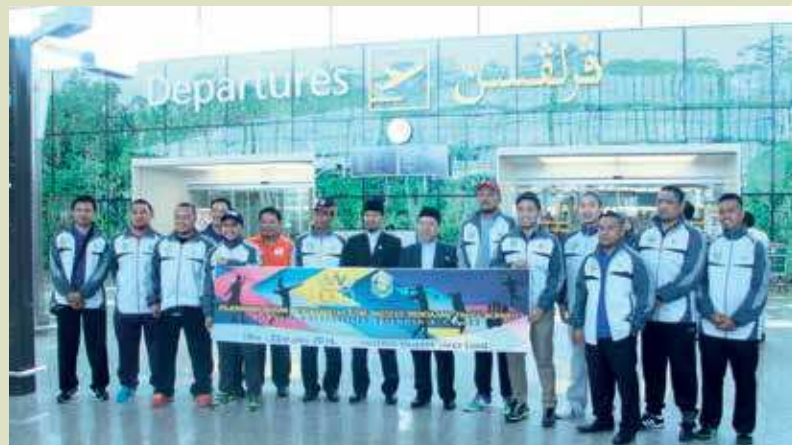
UNISSA sent 17 athletes to participate in Universities Friendship Games in Sabah

Seventeen athletes from Universiti Islam Sultan Sharif Ali (UNISSA) participated in the Borneo Universities Friendship Games hosted by Universiti Malaysia Sabah (UMS) from 12 – 14 Rejab 1437 correspondence to April 20-22, 2016.