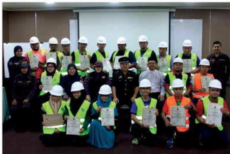
Group photo of UNISSA's participants attending the Fire Marshall Course

Activities carried out during the course include learning how to help victims in a fire situation, an action plan for dealing with emergencies, building evacuation procedures, going into a smokehouse as well as an introduction to fire prevention tools and how to use them. This would equipped the