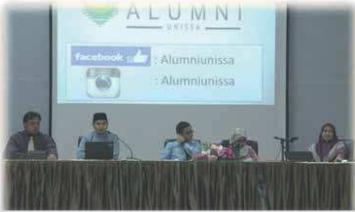
Taklimat Kerjaya 'Temu Duga' yang diadakan di Dewan Auditorium UNISSA

Unit Perkhidmatan Kaunseling dan Bimbingan Kerjaya, Bahagian Hal Ehwal Pelajar Universiti Islam Sultan Sharif Ali (UNISSA) telah mengadakan Taklimat kerjaya 'Temu Duga' pada 14 Sya'ban 1437 bersamaan dengan 21 Mei 2016 - taklimat tahunan khusus bagi bakal graduannya yang akan menceburi bidang pekerjaan.