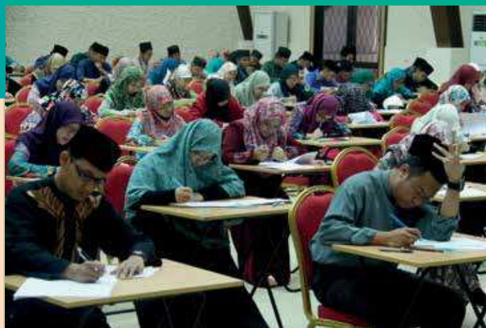
Para pelajar yang menduduki Peperiksaan Semester ke-2, 2015/2016

Universiti Islam Sultan Sharif Ali (UNISSA) melalui Hal Ehwal Pelajar seperti lazimnya telah mengadakan Solat Sunat Hajat dan doa selamat pada 22 Rejab 1437 bersamaan dengan 30 April 2016 bagi para mahasiswa dan mahasiswi yang menduduki Peperiksaan Semester Ke-2, 2015/2016. Para pensyarah dan pelajar-pelajar telah menyertai majlis tersebut yang berlangsung di dewan Auditorium UNISSA.