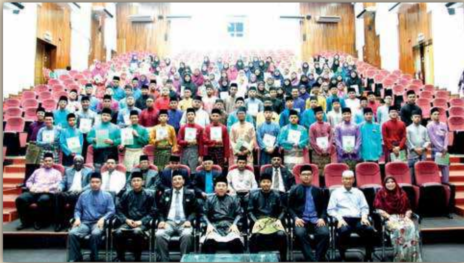
صورة الدورة المكثفة للمدير والموظفون والطلاب والطالبات

عدد الطلاب والطالبات الذين شاركوا في هذه الدورة المكثفة (١٥٠). وقد حضر حفل الاختتام مدير المركز وأعضاء هيئة التدريس وموظفو الجامعة. قام مدير الجامعة الدكتور الحاج نور عرفان بن الحاج زينل بتوزيع الجوائز على الأوائل وشهادات المشاركة على بقية الدارسين.