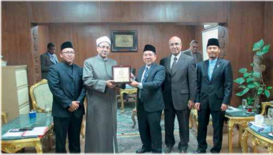
صورة للأمين العام لمجمع البحوث الإسلامية ورئيس جامعة السلطان الشريف علي الإسلامية والوفد المرافق له

التقى وفد رفيع المستوى برئاسة الدكتور الحاج نور عرفان الحاج زينل رئيس جامعة السلطان الشريف علي الإسلامية الدكتور محي الدين عفيضي، الأمين العام لمجمع البحوث الإسلامية يوم الإثنين ٢ شعبان ١٤٣٧ الموافق ٩ مايو ٢٠١٦ في مصر. لإنجاز هذا العمل على الوجه الذي يليق بجلالة القرآن الكريم. وأكد الأمين العام أهمية هذا العمل واستعداد مجمع البحوث الإسلامية لتقديم الخدمات اللازمة لذلك كما تم بحث عدد من الأمور العلمية المتعلقة بمهام مجمع البحوث الإسلامية وحاجة مسلمي بروناي إلى التراث العلمي الأزهري.