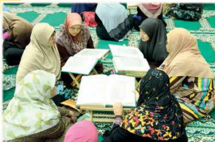
Para pensyarah dan staf yang ikut serta dalam majlis bertadarus