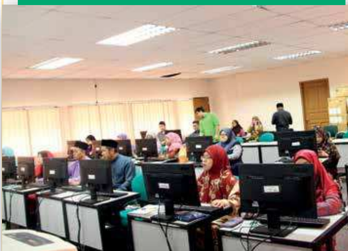
Para peserta yang mengikuti 'Bengkel Menerokai Ilmu ICT Secara Praktikal'