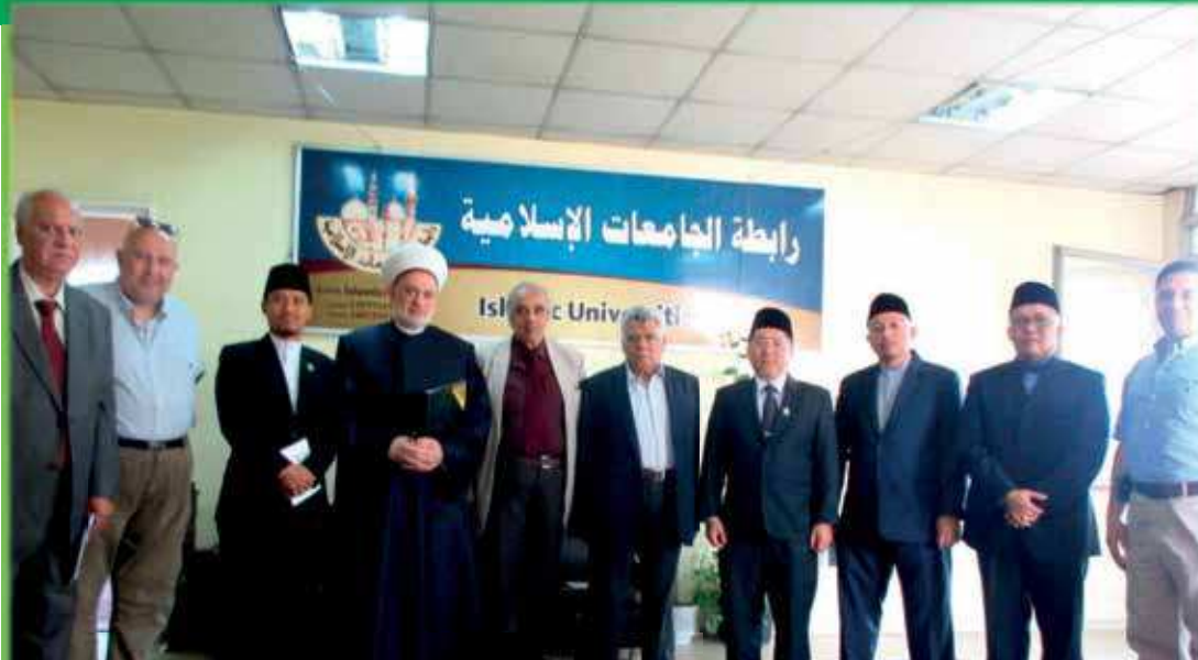
صورة للأمين العام لرابطة الجامعات الإسلامية بمقر رابطة الجامعات الإسلامية ورئيس جامعة السلطان الشريف علي الإسلامية والوفد المرافق له

استقبل وفد جامعة السلطان الشريف علي الإسلامية برئاسة الدكتور الحاج نور عرفان بن الحاج زينل رئيس الجامعة والوفد المرافق له والذي يزور مصر حاليا الدكتور جعفر عبد السلام الأمين العام لرابطة الجامعات الإسلامية بمقر رابطة الجامعات الإسلامية يوم الثلاثاء ٣ شعبان ١٤٣٧ الموافق ١٠ مايو ٢٠١٦، حيث يقوم بزيارة لشيخ الأزهر وجامعة الأزهر ومجمع البحوث الإسلامية في مصر.