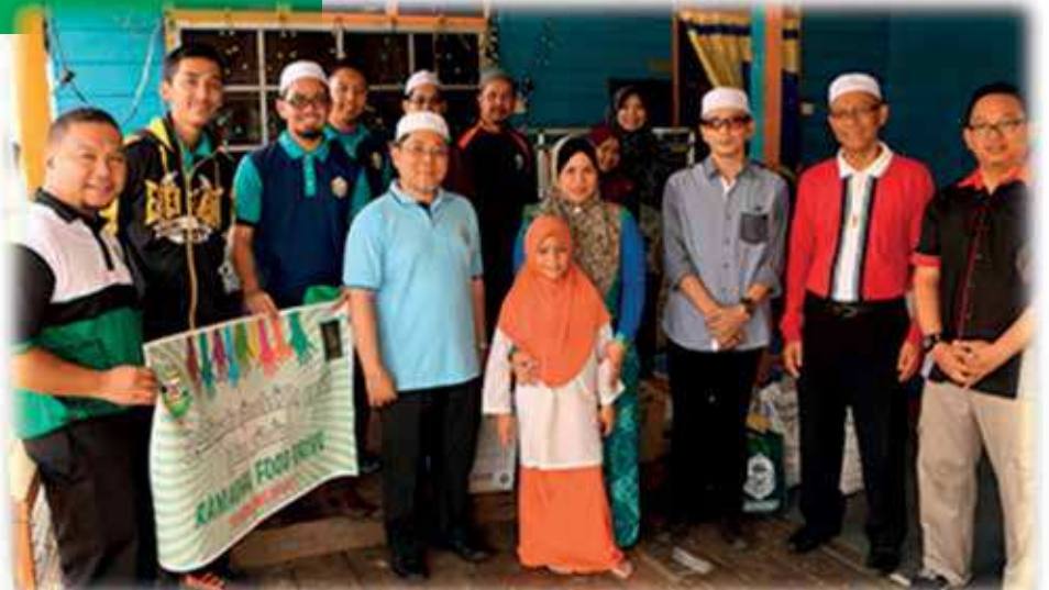
Rombongan UNISSA bersama keluarga yang mendapat sumbangan

kepada 35 buah keluarga terdiri daripada keluarga-keluarga orang kurang upaya (OKU) dan yang kurang berkemampuan.