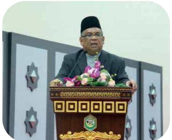
Yang Mulia Pengiran Dato Paduka Haji Bahrom bin Pengiran Haji Bahar, Timbalan Menteri Pendidikan, tatkala menyampaikan Kuliah Khas MIB

"Ilmu tidak pernah merugikan sesiapa kerana ilmu itu merupakan kunci kejayaan. Manusia tidak akan berubah tanpa ilmu dan bangsa tidak akan maju tanpa ilmu. Seterusnya negara tidak akan dapat membangun tanpa ilmu," jelasnya.