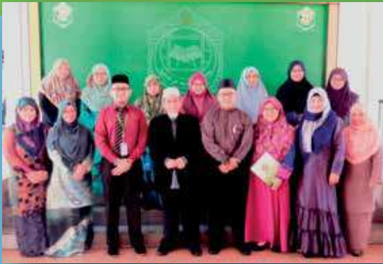
Para staf akademik yang mengikuti bengkel

Universiti Islam Sultan Sharif Ali (UNISSA) melalui Fakulti Bahasa Arab dan Tamadun Islam dengan kerjasama Pusat Penyelidikan dan Penerbitan telah mengadakan 'Bengkel Penulisan Artikel Ilmiah bagi Staf Akademik Tempatan Siri ke-2', pada 28 Sya'ban 1437 bersamaan dengan 4 Jun 2016.