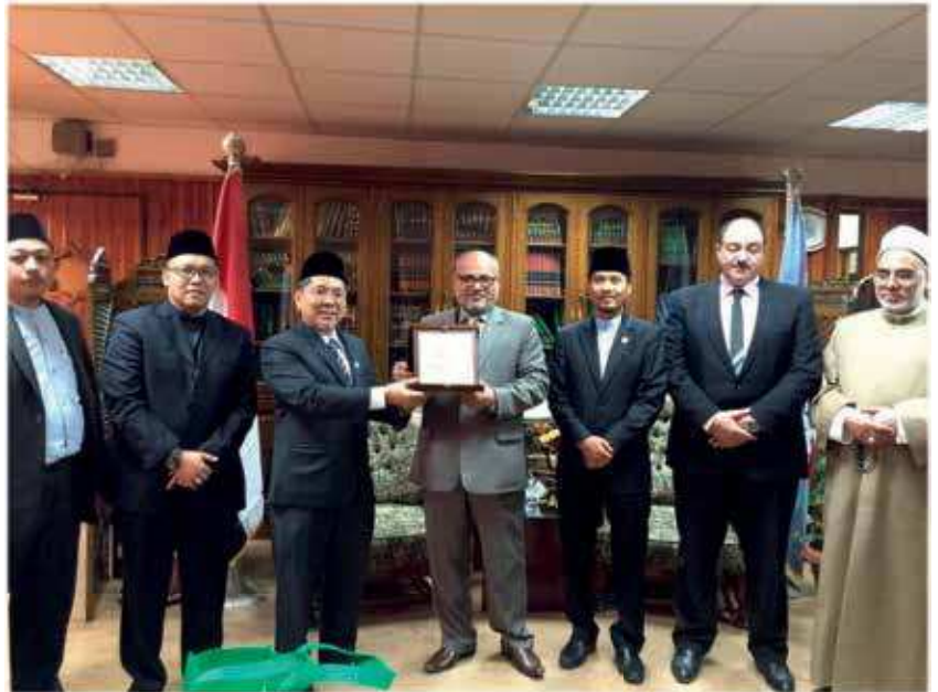
صورة لرئيس جامعة الأزهر ورئيس جامعة السلطان الشريف علي الإسلامية والوفد المرافق له

وبحث اللقاء استعانة مركز الإمام الشافعي بعدد من أساتذة جامعة الأزهر للتدريس بما طبقاً للبروتوكول الموقع بين جامعة الأزهر وجامعة السلطان الشريف علي الإسلامية في وقت سابق.