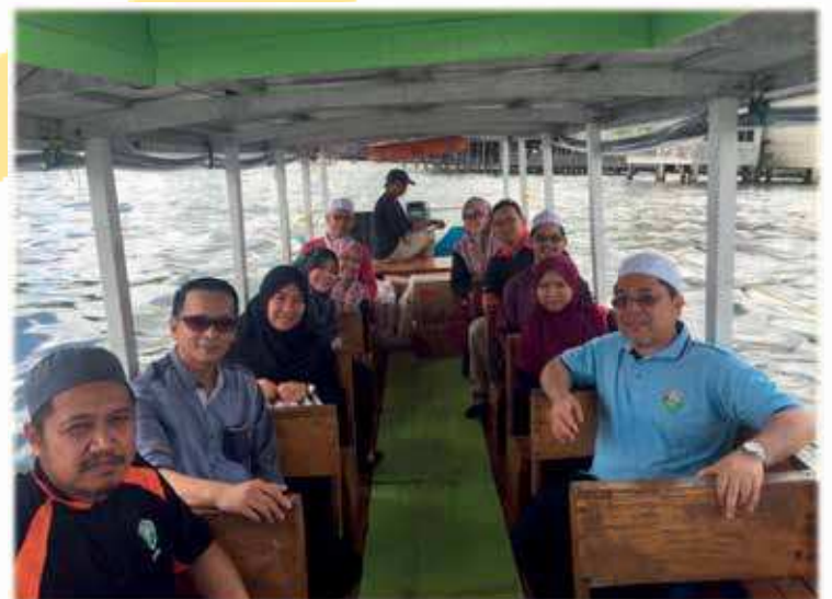
Rektor UNISSA bersama rombongan UNISSA