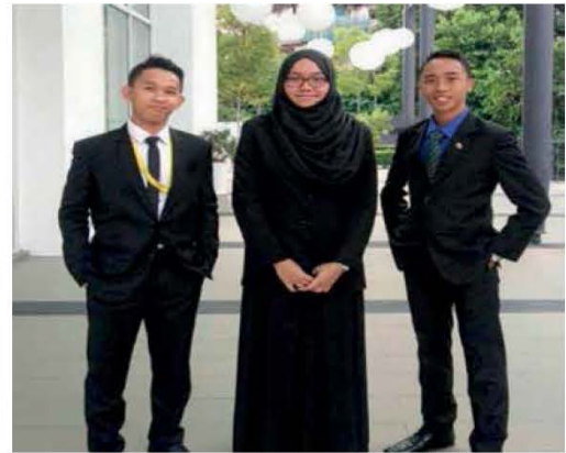
UNISSA students from the Faculty of Shariah and Law won the Thomas Phillips Moot Debate Competition at the Annual Conference Malaysia 2016.

Three members of the Asian Law Students' Association (ALSA) Brunei who are also students of the Shariah and Law from Universiti Islam Sultan Sharif Ali (UNISSA) won the Thomas Phillips Moot Debate Competition at the Annual Conference in Malaysia 2016.