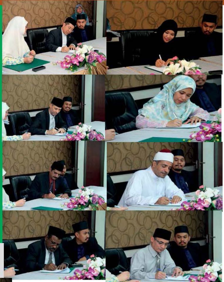
Some of the authors among UNISSA academic lecturers signing the publishing agreement held at the Banquet room, UNISSA. (Right and Left)

Most of the authors signing the agreement at UNISSA were academic members of the university itself.