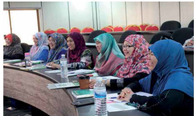
Sebahagian daripada peserta bengkel yang terdiri daripada pensyarah tempatan UNISSA.