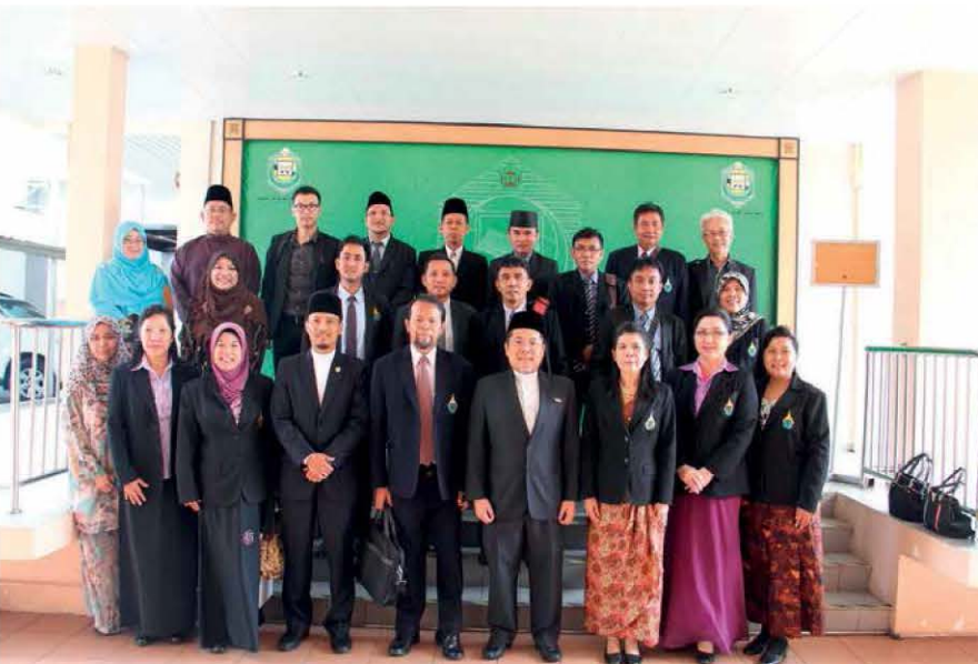
PNU Delegation from Thailand in a group photo with UNISSA Officials.

Other than sharpening their Arabic language proficiency, they also undertook courses such as Hifz Al-Quran, courses under the Faculty of Usuluddin, Faculty of Shariah and Law and Arabic Language and Islamic Civilisation.