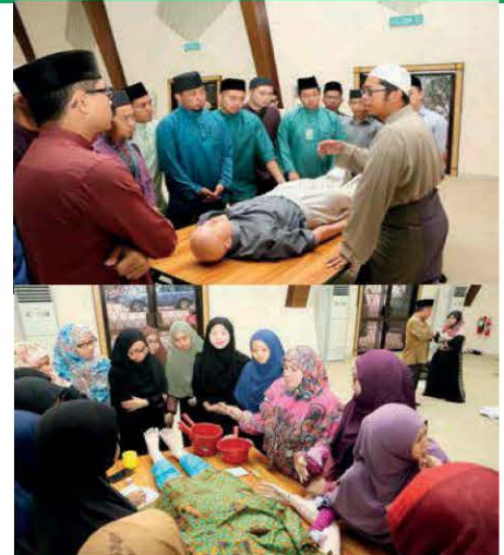
Mahasiswa dan mahasiswi UNISSA diberikan taklimat semasa Program Bengkel Pengurusan jenazah bertempat di Auditorium, UNISSA.

Antara tujuan bengkel ini diadakan adalah untuk memberi pendedahan tentang cara pengurusan jenazah dengan tepat dan seiring dengan syariat Islam serta mengikis fahaman yang merosakkan akidah. Di samping itu juga, bengkel ini dapat mendidik para mahasiswa dan mahasiswi supaya meneruskan tanggungjawab pengurusan jenazah terhadap keluarga, masyarakat juga negara. Seramai 120 mahasiswa dan mahasiswi menyertai bengkel berkenaan melibatkan pelajar tahun dua UNISSA.