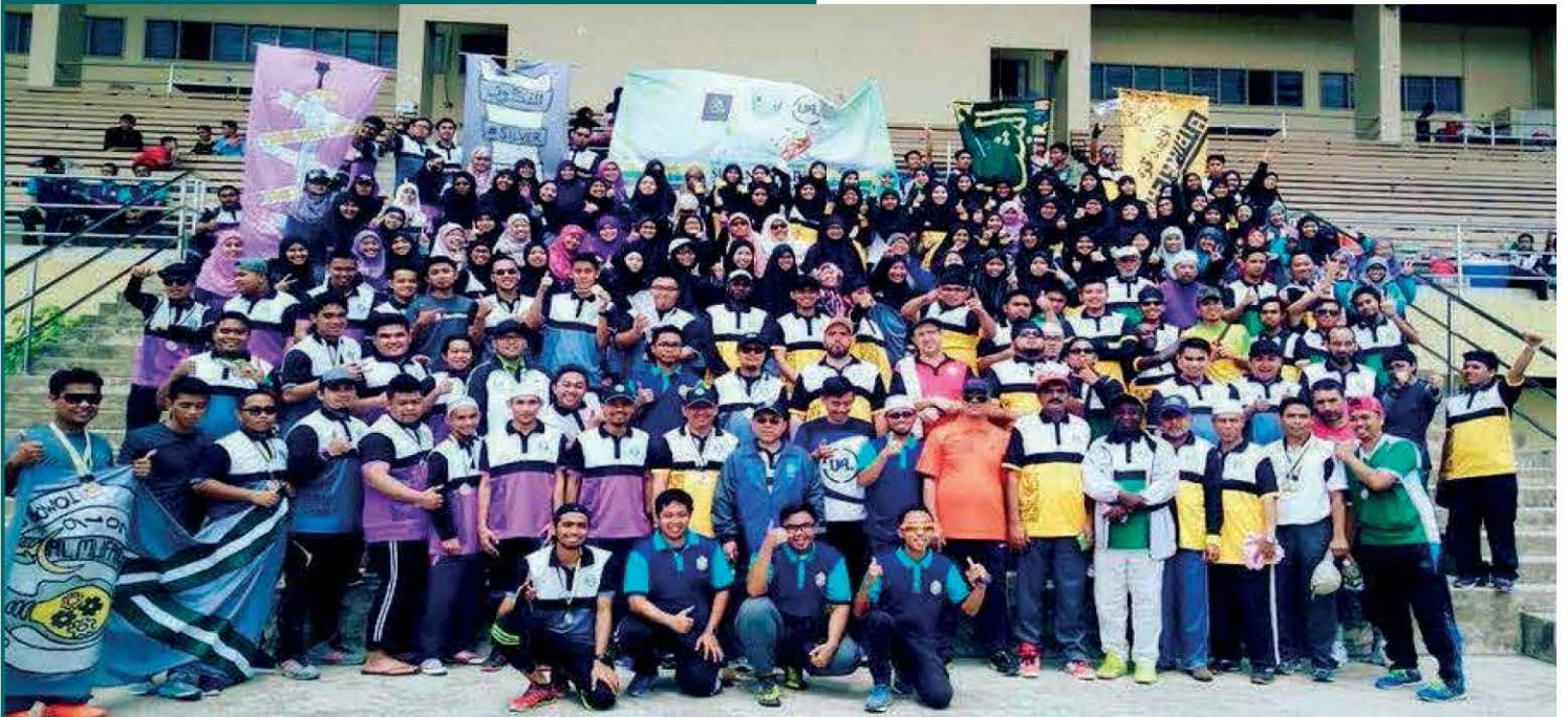
Para peserta yang mewakili setiap rumah sukan bergambar ramai semasa acara penutup Sukan Tahunan UNISSA dan Hari Usrah 2016 yang berlangsung di Padang dan Balapan, Maktab Duli Pengiran Muda Al-Muhtadee Billah.