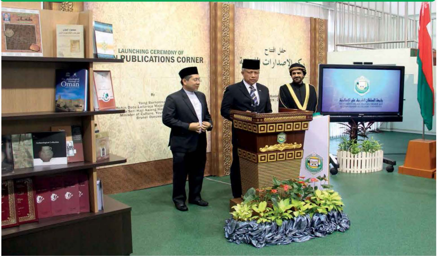
Pehin Datu Lailaraja Major General (Rtd) Dato Paduka Seri Haji Awang Halbi bin Haji Mohd Yussof, the Minister of Culture, Youth and Sports, launching the Oman Publications Corner held at UNISSA Library.